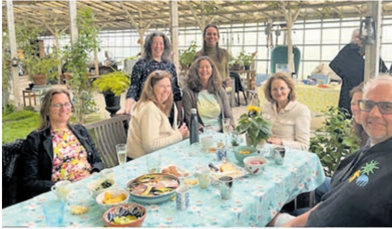
Eerste inspiratiemiddag voor de Geluksroute in Aalsmeer.