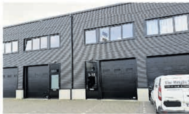
Burgemeester Hoffscholteweg 3-018 | Aalsmeer Huurprijs € 1.450,- per maand Bedrijfs-/kantoorruimte