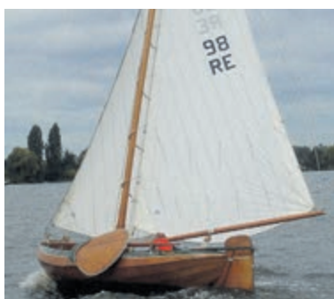
Wedstrijden Rond en Plat.