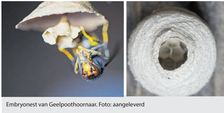
Embryonest van Geelpoothoornaar.

Onderdeel van Regio Media Groep B.V. www.regiomediagroep.nl