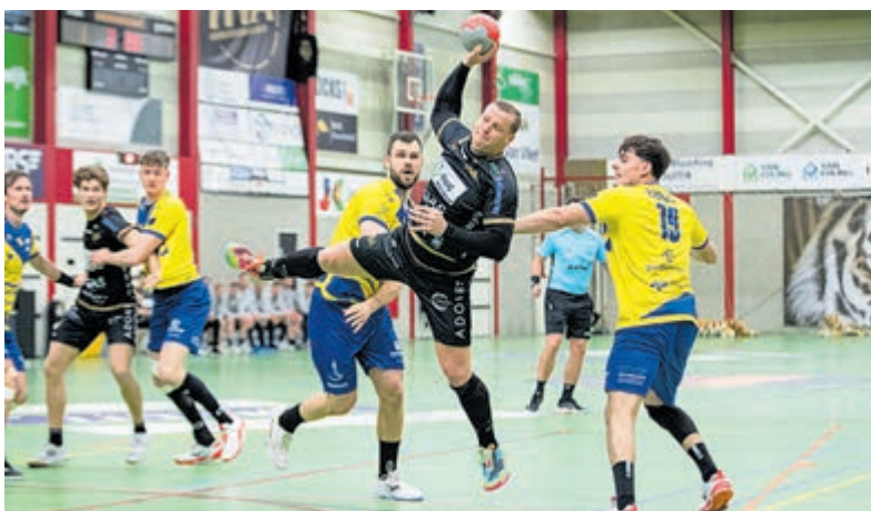
Zwaarbevochten overwinning voor Heren 1 HV Aalsmeer.

Voor het komende seizoen is Oradi/Omnia nadrukkelijk op zoek naar nieuwe leden om de teams aan te vullen. De vereniging biedt plek voor zowel dames- als herenteams. Naast deze seniorteams beschikt Oradi over diverse jeugdteams, waardoor er voor verschillende leeftijden en niveaus mogelijkheden zijn. Of je nu ambitieus wilt spelen of vooral op zoek bent naar gezelligheid en sportieve uitdaging: je bent van harte welkom om een keer mee te trainen en de sfeer te komen proeven. Stuur voor meer informatie een mail naar Volleybal@svomnia.nl .