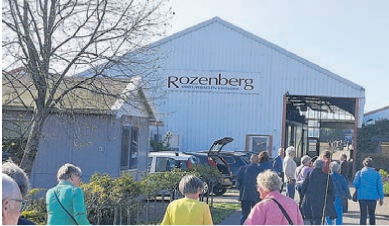
Belangstelling voor bedrijfsbezoek aan Rozenberg was groot.