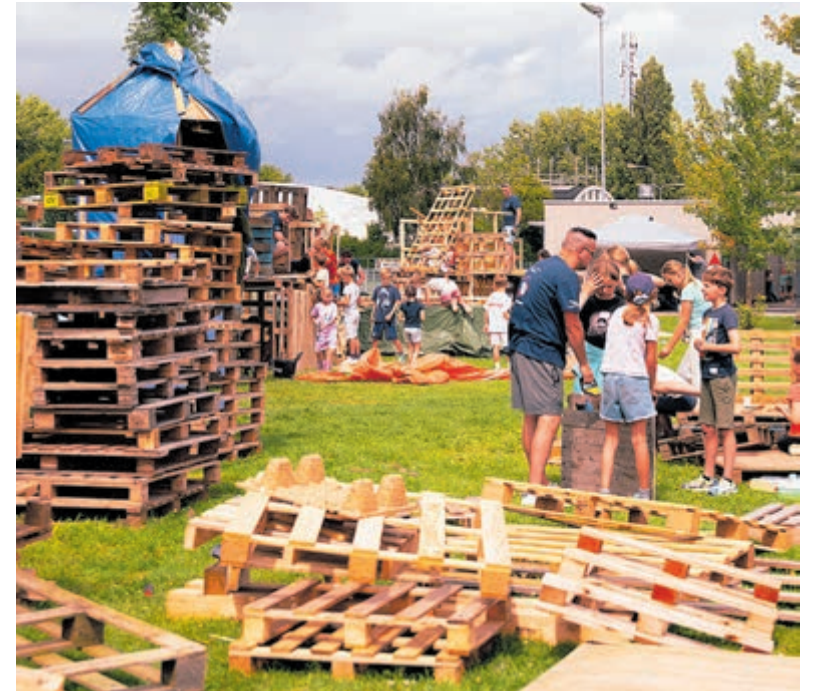
Kindervakantieweek: week hutten bouwen voor kinderen.

zien, zo worden de hutten altijd mooi versierd en zal er een creatieve opdracht zijn. De week heeft net als andere jaren weer een thema. Wat het thema precies is, wordt nog even geheim gehouden, maar de kinderen en begeleiders gaan samen terug in de tijd! De organisatie hoopt op een gezellige en zonnige week vol met prachtige hutten en plezier! Meer weten over de Kindervakantieweek of inschrijven? Ga naar www.debinding.nl (kampen/kindervakantieweekweek).