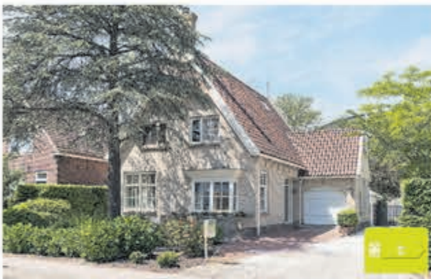
Dorpsstraat 117 | Aalsmeer Huurprijs € 4.950,- per maand