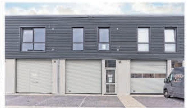
Zuid-Afrikaweg 8 F | Aalsmeer Huurprijs € 1.350,- per maand Bedrijfs-/kantoorruimte