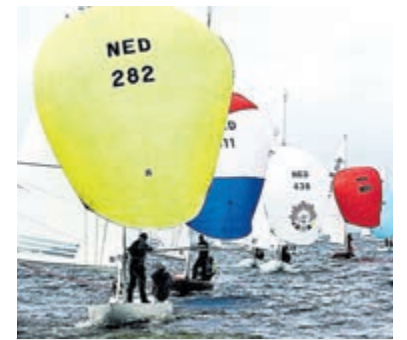
Grand Prix d'Aalsmeer met Draken op de Westeinder.

De Noorse scheepsarchitect Johan Anker ontwierp in 1929 een handzaam zeilscheepje, 8.95 meter lang; de Draak. Vandaag de dag wereldwijd de meest verbreide open zeilboot. Gedateerde houten Draken die verwend zijn met een totale refit hebben recent eerste plaatsen gezeild tijdens de Grand Prix d'Aalsmeer, waarmee de Drakenzeilers op de drie weekends rond Pasen het zeilseizoen al een generatie lang openen. De Draak wordt nog steeds splinternieuw gebouwd uit een computer gestu-