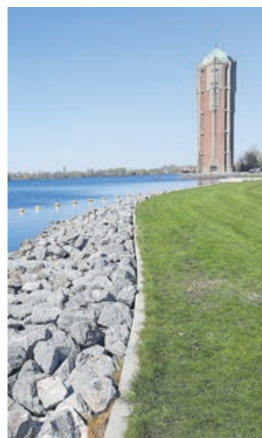
De watertoren aan de Westeinderplassen en het Waterfront.

allereerst om het gigantische bouwwerk van binnen te bewonderen, maar ook om naar boven te klimmen via trappen om vanaf circa 50 meter hoogte te genieten van een fantastisch 360 graden uitzicht over de regio. Als men alleen het binnenwerk vanaf de begane grond wil gaan bewonderen is de toegang gratis. Wil men ook naar boven dan is de toegangsprijs beperkt: volwassenen betalen 3 euro en kinderen de helft, 1,50 euro. Pinnen is mogelijk. Kijk voor meer informatie over Aalsmeers fraaie rijksmonument op: www.aalsmeer-watertoren.nl .