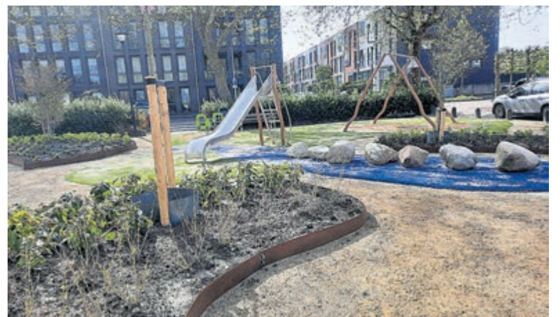
Groenere en speelsere inrichting voor het Weteringplantsoen.

Bij het ontwerp van de nieuwe inrichting zijn de bewoners actief betrokken geweest. Ideeën en wensen uit de buurt vormden de basis voor het uiteindelijke plan. "Zo maken we samen een plek die past bij de mensen die hier wonen en leven", aldus Spaargaren. Het vernieuwde speelterrein biedt kinderen volop ruimte om te klimmen, glijden, rennen en ontdekken. Na het doorknippen van het lint mochten de kinderen het terrein officieel 'veroveren' en werd de opening feestelijk afgesloten met ijsjes. De aanwezigen waren het unaniem eens: "Het Weteringplantsoen is een prachtige ontmoetingsplek geworden!" Als laatste wordt binnenkort ook het kunstwerk Viering weer teruggeplaatst in het gebied. Hierna is het project helemaal afgerond.