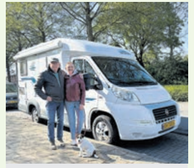
Klaar om op vakantie te gaan met de camper.