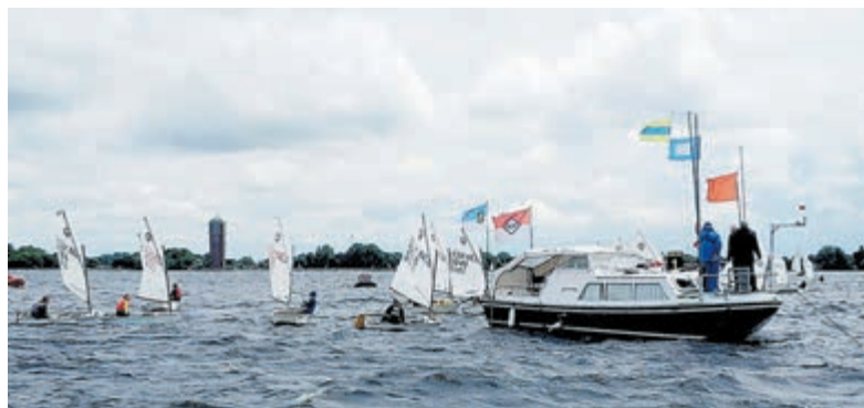
Combi Westeinder wedstrijden op de Grote Poel.

Vanaf de W.V. Nieuwe Meer hebben we mooi uitzicht op de Kleine Poel. Daar gaat op 6 en 7 juni de jeugd genieten van het zeilen tijdens het Combi Westeinder weekend deel uitmakend van de Combi Amsterdam. Zeilertjes vanuit Loosdrecht tot de Braassem of Haarlem komen er op af