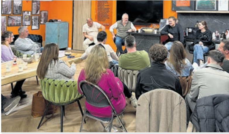
Laatste masterclass voor deelnemers Zaai coachproject.