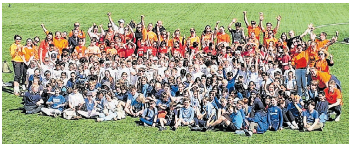
Leerlingen van Samen Een en De Zuidooster vormden samen met de begeleiding de Nederlandse vlag ter afsluiting van de Koningsspelen.

de route van het schip nauwkeurig te volgen en de juiste coördinaten op de kaart te combineren met informatie van schilderijen, konden de cijfercodes voor de vele sloten worden gekraakt. Het was spannend terwijl de tijd wegtikte op de klok op het grote scherm. Na het kraken van de laatste code en het ontsnappen uit de escaperoom werd hun inzet beloond. Als tastbare herinnering aan deze succesvolle ontsnapping ontvingen alle leerlingen een dukaat: een houten munt die symbool staat voor hun dapperheid en slimheid en het ontsnappen uit de escaperoom. Met de opgedane kennis en hun bewezen vaardigheden in navigatie en specerijen kennis zijn deze leerlingen nu helemaal klaar om symbolisch uit te varen met het schip de Rooswijk, op weg naar een van de verre koloniën uit de tijd van de VOC. Een leerzame ervaring die de geschiedenis voor de leerlingen van De Brug echt tot leven heeft gebracht.