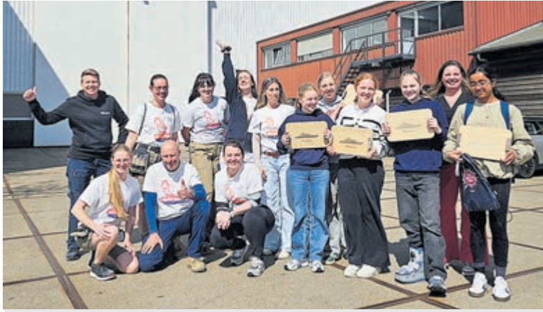
Girls' Day, 21 meiden van Vakcollege Thamen brachten een inspirerend bedrijfsbezoek aan Koninklijke De Vries Scheepsbouw.