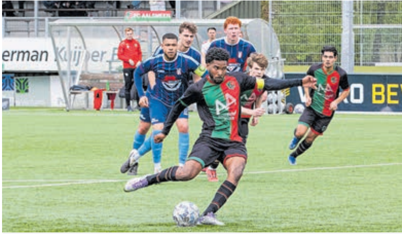
FC Aalsmeer in de aanval tegen Hollandia.