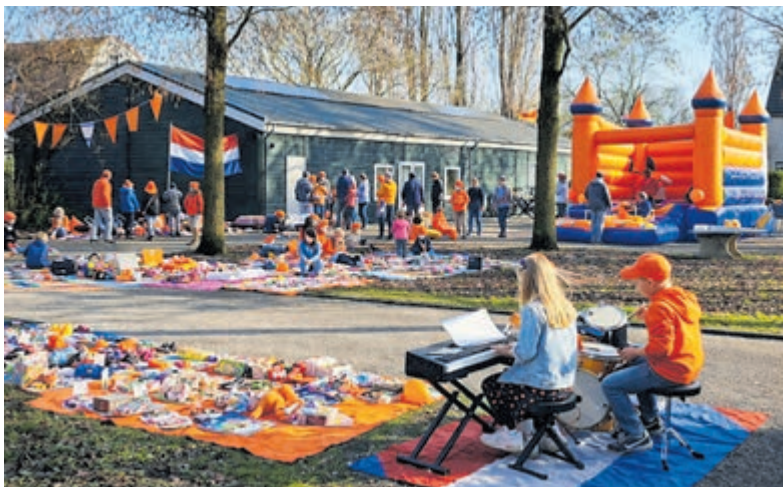
Vrijmarkt rond Buurthuis Het Middelpunt.

Aalsmeer - Op maandag 27 april is het weer gezellig rond Buurthuis Het Middelpunt. Na lange tijd organiseren de vrijwilligers van het Buurthuis opnieuw een vrijmarkt op Koningsdag. Kinderen kunnen vanaf 8.00 uur hun kleedje neerleggen om spullen te verkopen. Wie liever iets anders doet, kan ook een grabbelton maken, muziek spelen of een leuk spel bedenken voor andere kinderen. Rond het Buurthuis is er van alles te doen. Zo zijn er springkussens, een voetbaldoel en verschillende spelletjes voor kinderen. Ook is er een kraam met limonade, koffie, thee en fris. Daarnaast zijn er suiker-spinners en poffertjes. De vrijmarkt en activiteiten duren tot 13.00 uur. Aanmelden is niet nodig. Trek je oranje outfit aan en kom gezellig langs. Buurthuis Het Middelpunt is gevestigd aan de Wilhelminastraat 55 in Oosteinde.