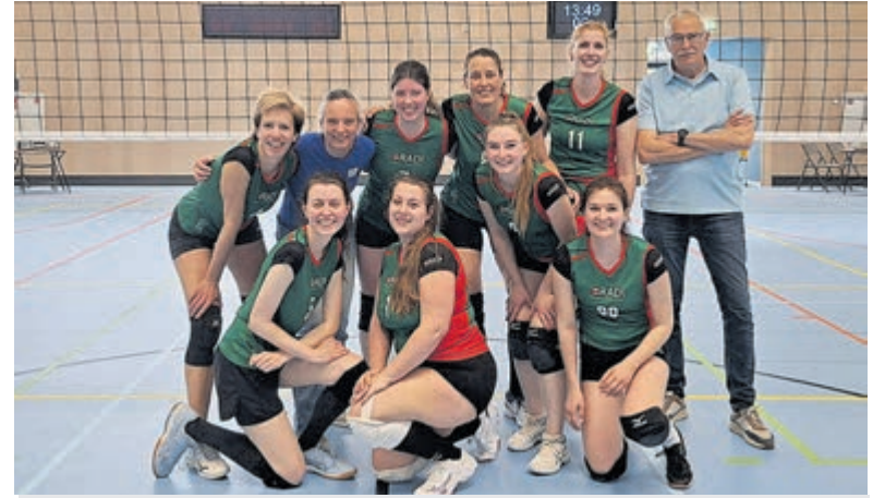
Damesteam van Volleybalvereniging Oradi/Omnia.

kreeg een goed spelend Aalsmeer te zien. Helaas werd dit niet beloond en moesten de voetballers de gasten van Hollandia uiteindelijk feliciteren met een 1-2 overwinning. Aalsmeer kwam vrij vroeg in de wedstrijd op achterstand, maar dankzij een treffer van Ilias Ahamout werd het 1-1 en deze stand bleef vrij lang op het scorebord staan. In de laatste minuten wist Hollandia toch nog langszij te komen en deze aanval resulteerde in de overwinning. Aanstaaende zaterdag 25 april is het eerste elftal vrij, evenals de teams 3 en 5 en de drie eerste dameselftallen. Kijktips: FCA 2 gaat zaterdag op bezoek bij Ajax en deze wedstrijd begint om 14.30 uur, FCA 4 gaat het uit opnemen tegen HSV Zuidvogels vanaf 13.30 uur en het eerste zondagelftal speelt zondag 26 april uit tegen HBC vanaf 14u. Uiteraard valt er aanstaande zaterdag ook genoeg aan te moedigen langs de velden bij FC Aalsmeer aan de Beethovenlaan. Kijk voor het programma op www.fcaalsmeer.nl .