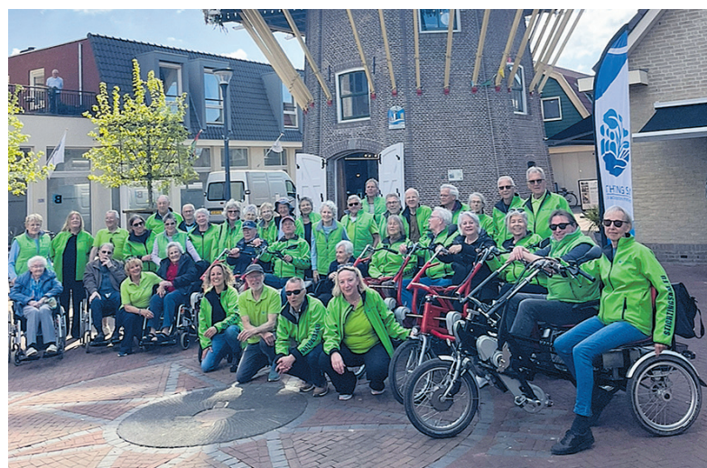
Feestelijke en zonnige start Stichting SAM bij de molen.