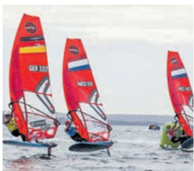
Surfen om grote prijs van Aalsmeer.

Na dit rondje over de belangrijkste zeilevenementen vaar ik in mijn vlet weer naar huis. Iets vergeten? Voor uw eigen nieuwsgierigheid: 6 uur Westeinder op 6 juni vanaf W.V. Schiphol. Kampioenschappen in de Spankers, Efsix, Sailhorse en Javelin vanaf de W.V. Aalsmeer op 11, 12 en 13 september. MicroMagic zeilen meestal op vrijdagmiddag ook bij W.V. Aalsmeer. ( micromagic.nl ). Westeinderplassen? Subliem zeilgebied!