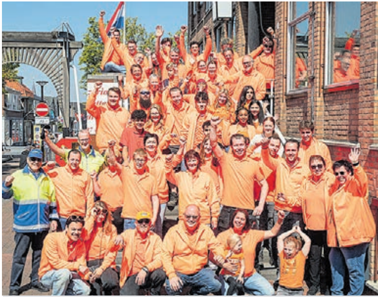
De vrijwilligers van het Oranjecomité Aalsmeer.