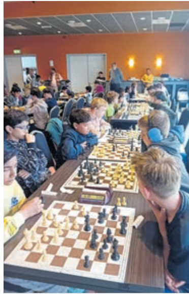
25e Grand Prix voor jeugd bij Schaakclub AAS.