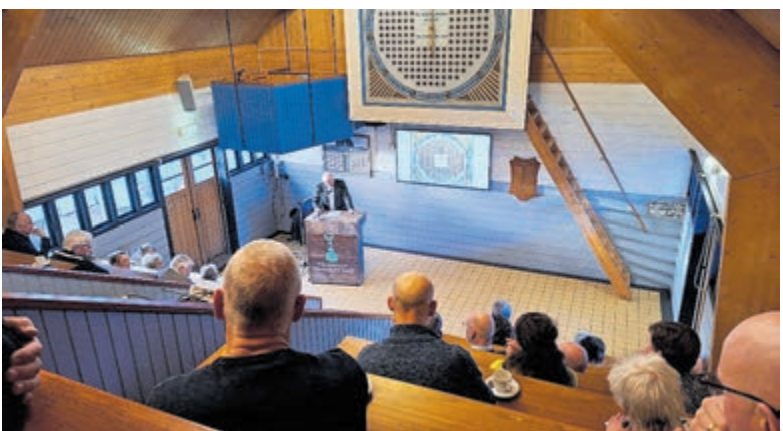
Veilen op de Jugendstil klok in de Historische Tuin.

Op dezelfde zaterdag vindt ook een openbare bloemen- en plantenveiling plaats in de Historische Tuin. In de sfeervolle veilingruimte doet de Jugendstil veilingklok dienst en kunnen bij afslag mooie bloemen en planten aangeschaft worden. De veiling begint om 15.00 uur. Toegang is inbegrepen met een entreekaartje voor het museum. Donateurs van de Stichting Historisch Aalsmeer en museumkaarthouders hebben gratis toegang. Ingang bij het Praamlein. Meer informatie: www.historischetuinaalsmeer.nl .