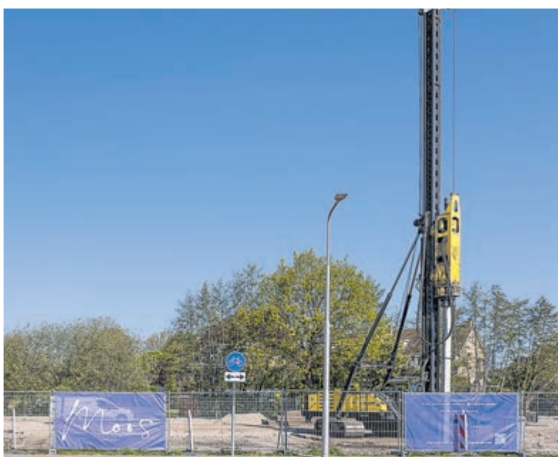
Eerste paal voor wooncomplex Ger van Halmhof aan de Bilderdammerweg.

kosten verbonden aan het bezoeken van de voorstelling en de kinderboerderij aan de Beethovenlaan, maar varken Beer staat zoals altijd klaar om donaties in ontvangst te nemen.