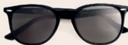
Ray-Ban 149,00 *incl. enkelvoudige HOYA glazen op sterkte