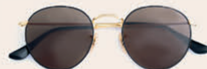
Ray-Ban 169,00 *incl. enkelvoudige HOYA glazen op sterkte