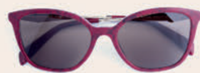
Prada 265,00 *incl. enkelvoudige HOYA glazen op sterkte