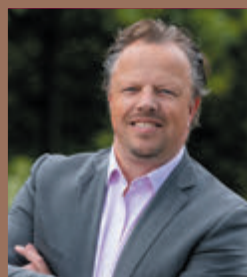
Alexander van der Pijl Dunweg Uitvaartzorg