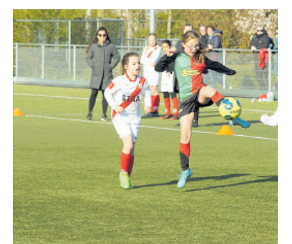
Tekst en foto: Ruud Meijer

menig SVIJ schot onschadelijk maakte. Eindstand 2-1.