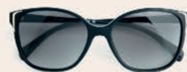
Prada 249,00 *incl. enkelvoudige HOYA glazen op sterkte