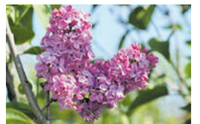
Live radio en tv bij de Themadag Seringen.