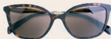
Prada 265,00 *incl. enkelvoudige HOYA glazen op sterkte