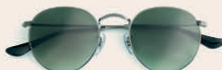
Ray-Ban 169,00 *incl. enkelvoudige HOYA glazen op sterkte