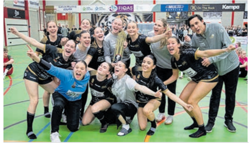
Spannende en goed gespeelde wedstrijden tijdens het Jac. Stammes Jeugdhandbaltoernooi.

volgende belangrijke ontwikkeling zagen de toeschouwers in januari 2026 tijdens een groot en sterk bezet toernooi bij RKAV Volendam. Na een zenuwslopende penaltyserie strandde Aalsmeer ongeslagen in de kruisfinale. Wat daarna gebeurde, bleek minstens zo belangrijk: de spelers bleven samen op het veld zitten, reflecteerden zonder coaches en groeiden zichtbaar als team. De teamgeest kreeg daar een volgende en belangrijke impuls. In de derde fase van het seizoen volgde de definitieve doorbraak. Tegen allemaal heel sterke tegenstanders bleef Aalsmeer zeven wedstrijden ongeslagen: vijf overwinningen en twee gelijke spelen leverden een knappe tweede plaats op. Vooral de laatste twee uitwedstrijden waren cruciaal. Bij Atletico Club Amsterdam draaide het duel onder lastige omstandigheden uit op een spektakelstuk. In het slotkwartier boog Aalsmeer een 2-2 stand om naar 2-4 met twee schitterende doelpunten. En in de allesbeslissende wedstrijd tegen AFC leek het team lange tijd onder druk te bezwijken, maar karakter en vechtlust hielden hen overeind. In de allerlaatste minuut viel alsnog de winnende treffer uit een corner: 2-3. Het laatste fluitsignaal werd gevolgd door een explosie van vreugde. Springende, juichende spelers vierden niet alleen de overwinning, maar ook hun plek aan de top!