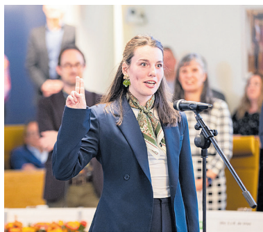
Met trots werd de eed of belofte afgelegd.