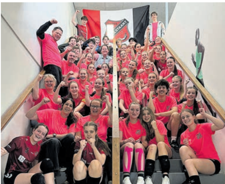
De oudste jeugdteams van RKDES Handbal.

wedstrijden voor een volle tribune. De A dames van HV Aalsmeer gingen er wel met de hoofdprijs vandoor. In een zenuwslopende finale vochten zij tot de laatste minuut en trokken zij uiteindelijk verdiend aan het langste eind! Tussen de finalewedstrijden door waren er leuke optredens van diverse Aalsmeerse dansscholen. Met mooie optredens wisten de jonge dansers het publiek te verrassen en brachten zij extra feestelijkheid in de hal. De organisatie bedankt alle vrijwilligers, sponsors en betrokkenen die dit bijzondere jubileum mogelijk maakten. Dankzij hun inzet werd het een sportief en feestelijk weekend om trots op te zijn.