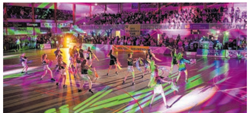
De jubileumeditie werd extra feestelijk met optredens van een viertal dansscholen uit Aalsmeer.

de beginnerscursus door een mailtje te sturen naar: bmx-trainers@uwtc.nl