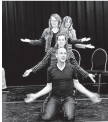
Cursisten Theatersport gaan het podium op.

hilarische en verrassende momenten leiden. De cursisten leerden acts als het orakel, drie-in-een-pannetje met diverse muziekstijlen en filmgenres. Een doventolk, een emotioneel feestje, een klachtenbureau of 'dierenarts' allemaal verschillende manieren om theatersport te beoefenen. Nieuwsgierig geworden? Op woensdagavond 29 april staan zij voor het eerst op het podium met publiek in Cultureel Café Bacchus aan de Gerberastraat! Spannend voor de spelers, maar vooral een avond vol humor, creativiteit en onverwachte wendingen voor jou als bezoeker. Als publiek ben je niet alleen toehoorder, je bepaalt wat de spelers gaan uitbeelden, met welke emotie en welke uitdagingen zij krijgen.