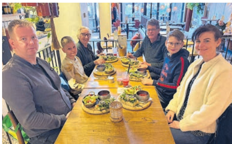
Wens familie Tolle vervult: samen lunchen.