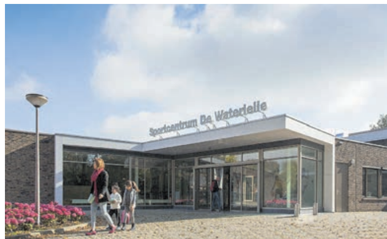
De entree van sportcentrum De Waterlelie.

Bezoekers van Sportcentrum De Waterlelie kunnen op een groot bord bij de entree de tijdlijn van de bouw volgen. Kijk voor meer informatie over de nieuwbouw en het proces op: www.aalsmeer.nl/nieuwzwembad .