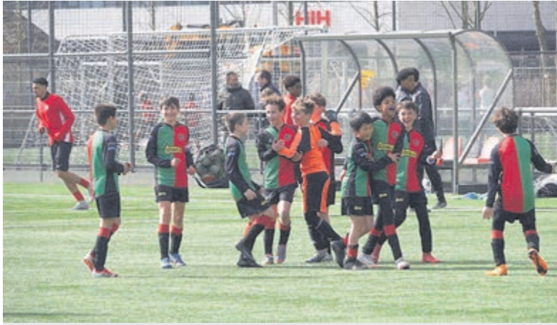
Juichende spelers van FCA JO11-1 vieren hun plek aan de top.