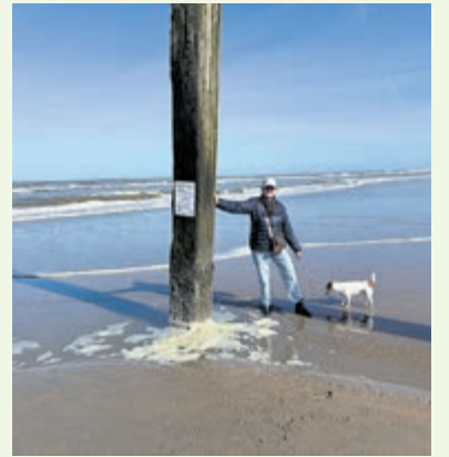
Strandwandeling met 'blij ei' Teuntje.