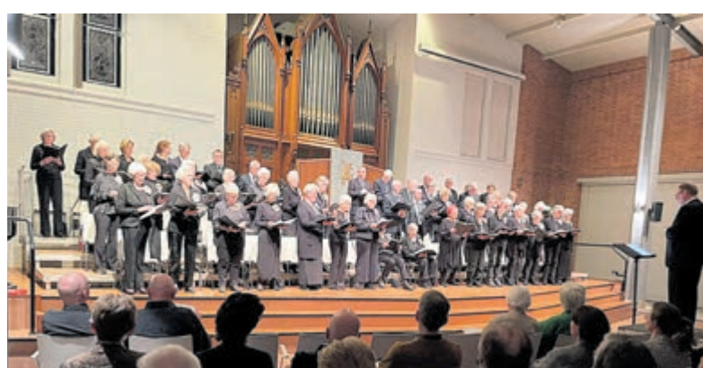
Aalsmeerse Christelijke Oratorium Vereniging in concert.

hoogtepunt worden op het openbare concert in maart 1828 in de concertzaal van de 'Gesellschaft der Musikfreunde', dat geheel aan het werk van Schubert gewijd was. De cantate vertelt het aangrijpende Bijbelse verhaal van de uittocht uit Egypte, waarin Mirjam – de zuster van Mozes – terugblijkt op de doortocht door de Rode Zee en de ondergang van de farao en zijn leger. In verschillende muzikale delen wordt dit dramatische verhaal tot leven gebracht, met een grote rol voor, tijdens dit concert, het orgel. Het slotdeel klinkt als een triomf op de jarenlange onderdrukking. Naast dit meesterwerk van Schubert staan ook andere composities van zijn hand op het programma, evenals werken van Brahms en Mendelssohn. Daarmee belooft het concert een veelzijdige en boeiende muzikale avond te worden. De toegangsprijs bedraagt 18,50 euro en dit bedrag is inclusief een drankje. Kaarten voor dit concert zijn verkrijgbaar via de leden, te koop aan de zaal en online verkrijgbaar via www.acov.nl .