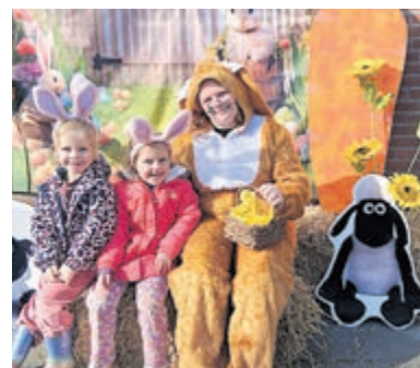
Met de paashaas op de foto bij Boerenvreugd.

kinderen kijkt Boerenvreugd weer terug op een geslaagd paasfeest.