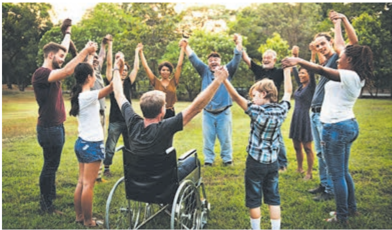
Subsidieregeling voor meer verbinding en begrip.