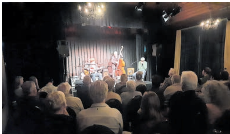
Volle Bacchus-zaal voor de Hein Meijer Bluesband.

Wie weet spot je hier wel het acteer-talent van de toekomst! Kaarten zijn verkrijgbaar via de ticketshop op de website van KCA.