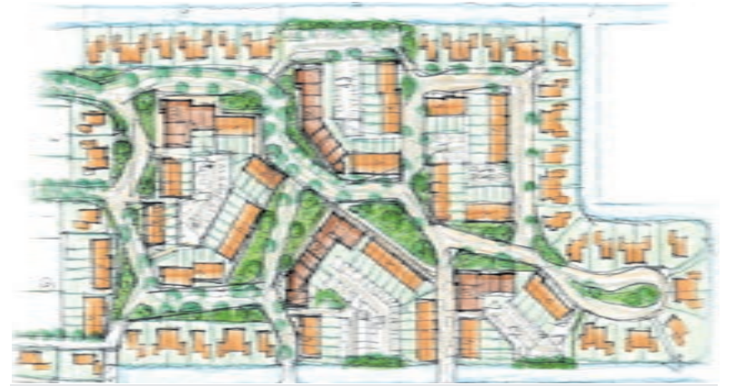
Voorstel voor bouw van 337 woningen in Hoofdweg-Zuid.

handjes kunnen gebruiken, zijn aanwezig van 13.30 tot 16.00 uur. Wie interesse heeft op ook duurzaam aan de slag te gaan en vaardigheden op het gebied van knutselen en repareren heeft, kan langs komen voor meer informatie of stuur een mail naar repaircafewesteinder@gmail.com . Op dinsdag 21 april wordt Place2Bieb in Kudelstaart omgeto-