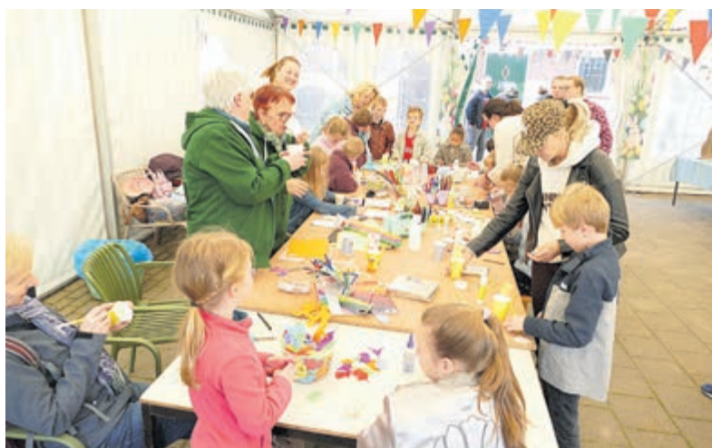
Knutselen voor pasen bij kinderboerderij Boerenvreugd.

energie te besparen. Met praktische tips, leuke opdrachten en veel enthousiasme lieten de jonge raadsleden zien dat iedereen, hoe klein dan ook, kan bijdragen aan een duurzamere wereld. Benieuwd wat jij thuis kunt doen om energie te besparen? Kijk dan op www.aalsmeer.nl/duurzaamheid .