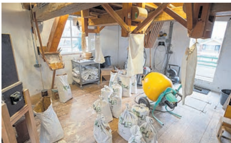
Kijkje in korenmolen De Leeuw.

Aalsmeer - Feest bij de molen in de Zijstraat dit weekend, want De Leeuw draait en maalt liefst dertig jaar. Er staan diverse activiteiten op het programma, waaronder 30 uur achter elkaar draaien en wellicht malen met en dankzij de vrijwilligers. Om 11.00 uur op vrijdag 10 april wordt hier het startsein voor gegeven en zaterdag 11 april klinkt het slotsignaal om 17.00 uur en mag een gokje gewaagd worden hoeveel omwentelingen de molen heeft gemaakt deze dertig uur. Vrijdag om 20.30 uur is de officiële aanvang van het feestweekend met de opening door burgemeester Gido Oude Kotte en voorzitter van de stichting (en