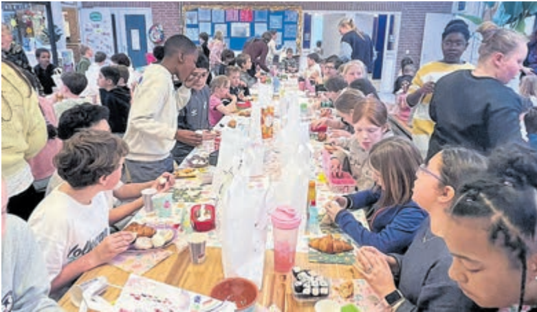
Gezamenlijke paaslunch bij KC de Ruimte in Kudelstaart.

van een speurtocht. De leerlingen van groep 7/8 begeleidden de leerlingen van groep 1/2 langs allerlei stenen. Als de letters op de goede plek bij de stenen werd geschreven, kwam er een zin uit. Onderweg werd voor een versnapering gezorgd. Wat waren de kinderen hard bezig om alles te vinden. Op school werd er in de middag een gezamenlijke paaslunch gehouden. Nadat de leerlingen de mooi versierde lunchtassen hadden bewonderd van de kinderen aan hun tafel, werd het laatste stukje van het paasverhaal voorgelezen. Daarna was het tijd om met elkaar te eten en samen te zijn.