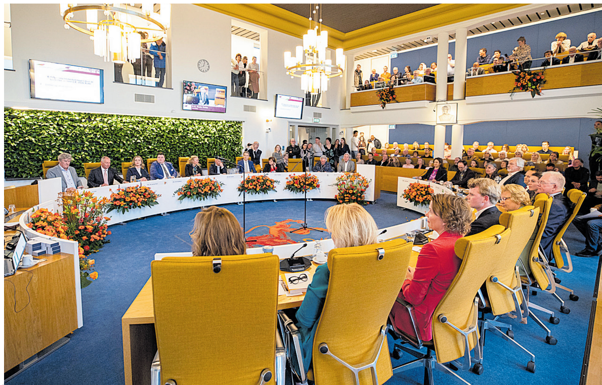
Volle tribunes tijdens de installatie van de nieuwe gemeenteraad.