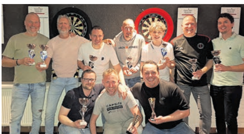
De finalisten van het koppelritten bij Poel's Eye.

Morgen, vrijdag 10 april, is de laatste speelavond van het seizoen. Aansluitend is de feestelijke prijsuitreiking van het seizoen. Dartclub Poel's Eye is laagdrempelig voor zowel dames als heren en dankzij het vier niveau systeem komt iedereen op zijn eigen niveau terecht. De inschrijving sluit om 20.00 uur. Deelname kost 4 euro en de minimum leeftijd is 15 jaar. Op de website www.poelseye.nl is nog meer informatie te vinden.