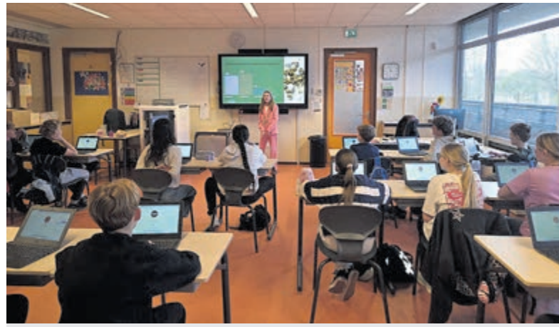
Energielessen van kinderraadsleden op scholen.

sponsorcontracten, opbrengsten vanuit de Kudelstaartse kienavonden en giften naar aanleiding van een aanvraag via de website www.stichtingsupportingkudelstaart.nl . Verblijft met een vergoeding van SSK zijn: RKDES (8.049,50), Dorpshuis Kudelstaart (7.350,10), Korfbalvereniging VZOD (4.537,50), Tennisvereniging Kudelstaart (2.256,25), Carnavalsvereniging de Pretpeurders (2.131,11), Handboogvereniging Target (1.275,50), Sjoelclub Aalsmeer (1.275,-), BRIK (Bridge in Kudelstaart (1.000,-), Stichting Kudelkamp (818,75), Damesvereniging Kudelstaart (807,50), Avondvierdaagse Kudelstaart (602,84), Stichting SAM (500,-), Gelegenheidskoor (450,-), Stichting Zonnebloem afdeling Kudelstaart (322,50), Schaatstraininggroep VZOD (300,-), Dameskoor Vivace (300,-), Bridgeclub De Uitkomst (300,-), Atletiekvereniging Aalsmeer (Westeinderloop) (300,-), Tifosi Kudelstaart (250,-), Feestcommissie Kudelstaart (228,75) en Skeelerbaan Kudelstaart (201,25).