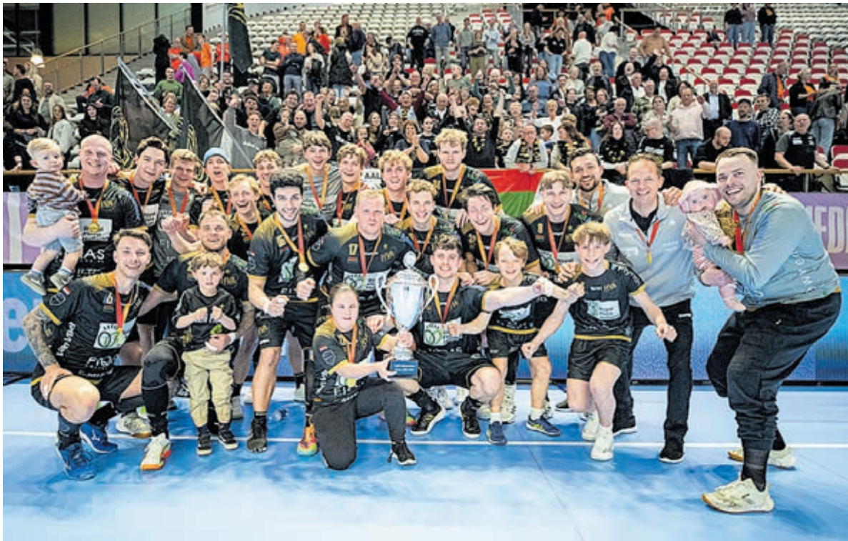
Het trotse team van RFH Handbal Aalsmeer en kinderen met de beker.