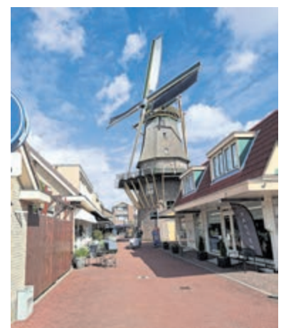
That's Life' live bij jubileumfeest Korenmolen.

Zondagmiddag 19 april kan in The Shack genoten worden van een Tribute to Nirvana. Alle verdere informatie en het volledige programma is te vinden op: www.the-shack.info . Adres: Schipholdijk 253b, Oude Meer.