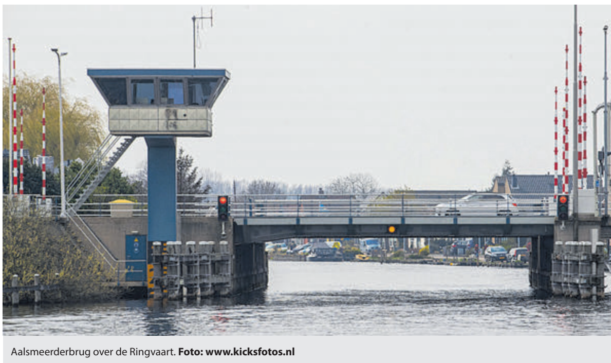
Aalsmeerderbrug over de Ringvaart.

Met vragen of opmerkingen kunnen (vaar)weggebruikers contact opnemen met het Servicepunt van de provincie via 0800-0200 600 (gratis) of mailen naar servicepunt@noord-holland.nl . Meer informatie over het varen op de Blauwe Golf met een digitale vaargids is te vinden op www.noord-holland.nl/blauwegolf . Kijk voor alle brugopeningstijden op www.vaarweginformatie.nl .