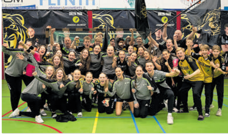
De C-kampioenen van het Jac. Stammes toernooi.