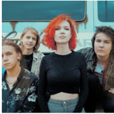
Indierockband Outlaw Queen doet vrijdag in N201 een gooi naar een finaleplek.