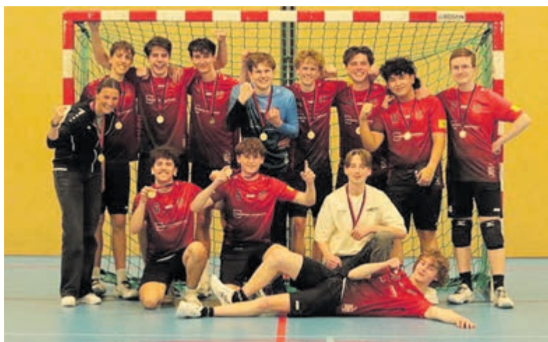
De trotse kampioenen van RKDES HA1.