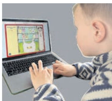
'EchtWel' duikt in de digitale opvoeding.