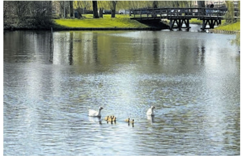
Genoeg om blij van te worden, zoals nieuw leven in de vijvers.