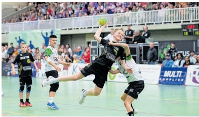
Handbaltalenten in actie tijdens het Stammes toernooi.