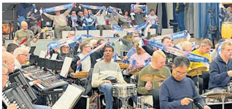
Er wordt al hard gerepeteerd en geoefend voor de show.