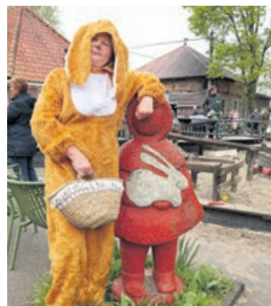
Eierbingo, spelletjes en de paashaas bij Boerenvreugd.

evenementtent. Er zijn geen extra kosten verbonden aan de activiteiten maar spaarvarken Beer staat zoals altijd klaar om donaties (cash of via de QR-code) in ontvangst te nemen. De activiteiten zijn tweede Paasdag van 10.00 tot 13.00 uur, daarna blijft de boerderij open tot 16.30 uur, zodat er nog heerlijk gespeeld kan worden in de speeltuin of een kijkje genomen kan worden bij de dieren. In de wei lopen de jonge geitjes en lammetjes, altijd leuk een om een bezoekje aan ze te brengen. Kortom, een gezellig paasuitje voor het hele gezin bij kinderboerderij Boerenvreugd aan de Beethovenlaan 118.