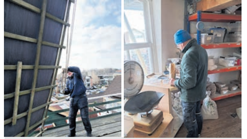
Molen De Leeuw draait en maalt dankzij vaste groep vrijwilligers.

Ambacht met rijke geschiedenis De sering is meer dan alleen een mooie bloem: het kweken van seringen is een ambacht met een rijke geschiedenis in Aalsmeer. Al tientallen jaren vormen de vruchtbare akkers van het Bovenlandengebied de thuisbasis voor de teelt van seringen en andere trekheesters. Hoewel de productie steeds meer onder druk staat, zijn er nog steeds kwekers die deze bloemen met veel energie en liefde telen. Tijdens het Seringenweekend wordt dit bijzondere verhaal extra onder de aandacht gebracht, zodat een breed publiek kan kennismaken met de schoonheid en betekenis van deze bloem. Het Seringenweekend is zaterdag 4, zondag 5 en maandag 6 april van 10.00 tot 16.30 uur. De ingang van het museum is aan het Praamlein. Hier is ook gratis parkeergelegenheid (met parkeerschijf). Kijk voor meer informatie en het volledige programma op: www.historischetuinaalsmeer.nl .