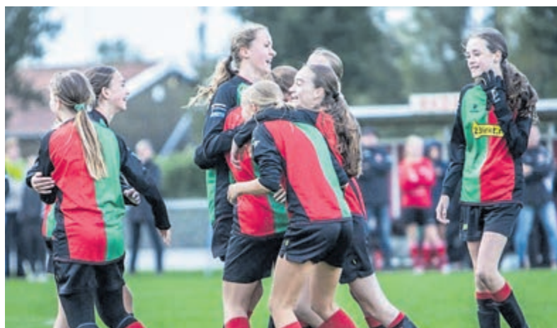
Verdiende zege voor meiden FC Aalsmeer MO15-1.

Promotie naar hoofdklasse Met dit kampioenschap heeft RKDES JO12-1 promotie afgedwongen naar de hoofdklasse. Dat zal ongetwijfeld een flinke uitdaging worden, maar gezien de inzet, teamspirit en ontwikkeling is er alle vertrouwen dat dit fantastische team zich ook daar goed zal laten zien.