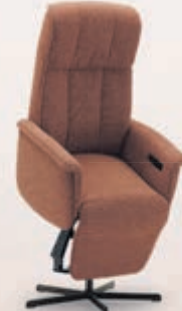
Sta-op stoel Rialto