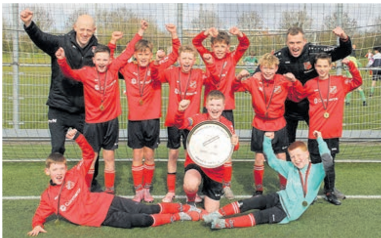
De trotse periodekampioenen van RKDES JO12-1.

wat pech te hebben dit partje. Hij krijgt twee kansen die op de lat en op de paal eindigen. Gelukkig krijgt hij nog een derde kans die in het doel eindigt. Vlak voor het eind komt Ruben aan de bal. Hij gooit op de paal. Hij bemachtigt nogmaals de bal en dit keer scoort hij net binnen de tijd. Tussenstand na het derde partje 1-2. Er kan nog van alles gebeuren in het laatste partje. Vivax scoort snel, dus de spanning bij de ouders stijgt. Davi is de held van dit partje. Hij houdt een paar moeilijke ballen uit het net. Raphael krijgt de bal, maar die eindigt helaas in handen van de keeper. Raiden weet te scoren. Dit blijkt de redding voor Oceanus te zijn. Er ontstaat nog een kans in de laatste zenuwlopende minuut van de wedstrijd, maar er wordt helaas niet meer gescoord. Na een zinderend spannende wedstrijd mocht Oceanus met de winst naar huis.