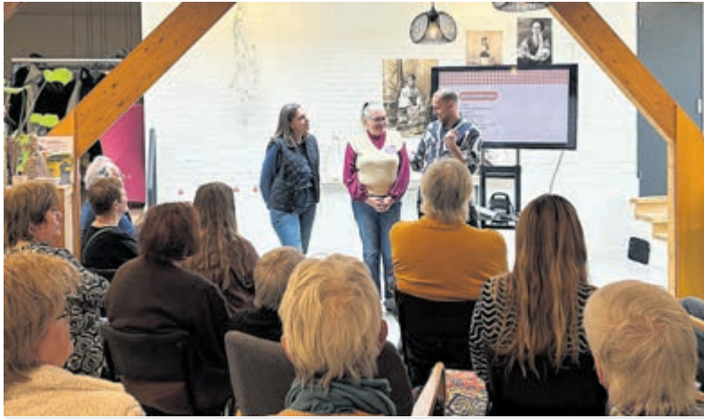
Informatieve gesprekken tijdens Cultuurcafé Aalsmeer.