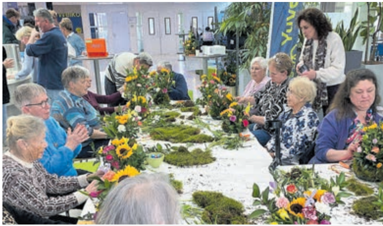
Deelnemers De Zonnebloem maken paasstukjes bij Yuverta.

Rijsenhout Dorpshuis Rijsenhout Werf 2 Plus Werf 15