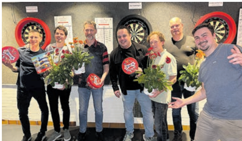
De finalisten van de dartavond bij Poel's Eye.