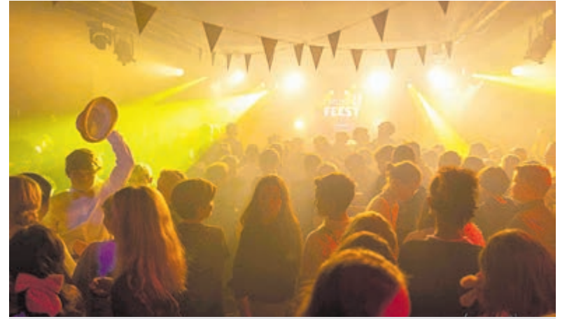
Drukte op de dansvloer tijdens het Groep 8 Feest in december.

winnaar. Het is een afsluitend spelletje waar menig deelnemers niet genoeg van krijgen. Winnaars van deze editie zijn groep 8 Antonius-school, groep 7 Triade en groep 6 Zuidooster. Voor hen was er een mooie beker en een zak met lekkers voor alle spelers. Elk kind ontving een herinneringsvaantje. Gelet op de reacties van de kinderen, ouders en Volant '90 begeleiders was het weer een geslaagd toernooi. Badminton vereniging Volant '90 speelt elke dinsdagavond in de Proosdijhal Kudelstaart. Ook een keer proberen? Belangstellenden zijn van harte welkom. Meer informatie via: www.volant90.nl