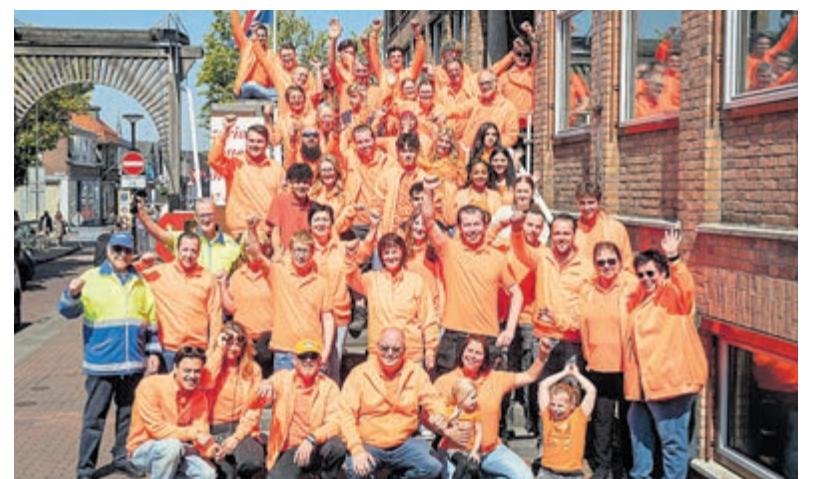
De groep vrijwilligers van het Oranjecomité Aalsmeer in 2025.