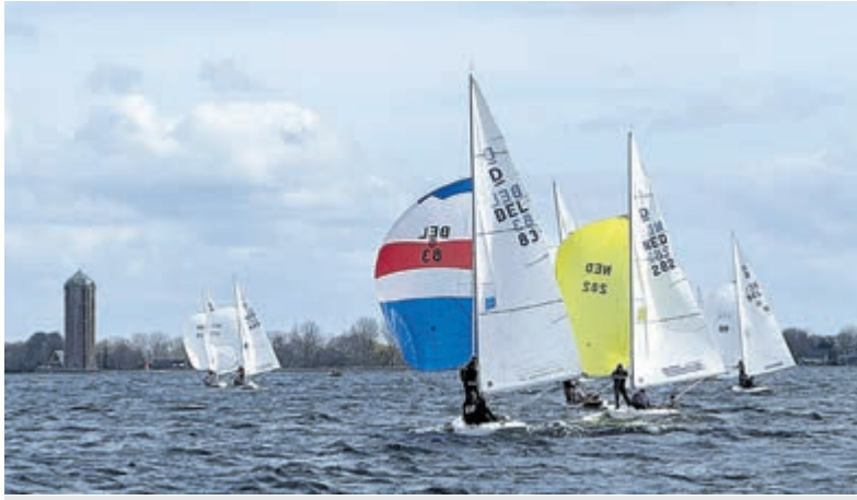
Zeilwedstrijden op de Westeinderplassen.