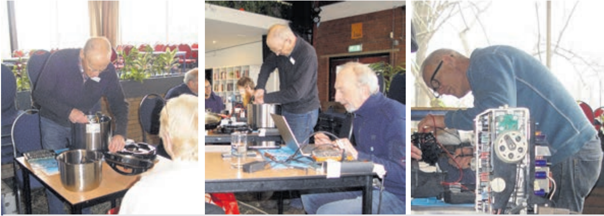
Vrijwilligers aan het werk tijdens het Repair Café.