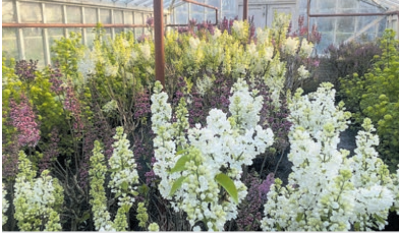
Seringen in de Historische Tuin.