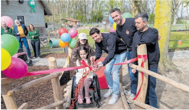
Inclusief speeltoestel bij Boerenvreugd feestelijk geopend.