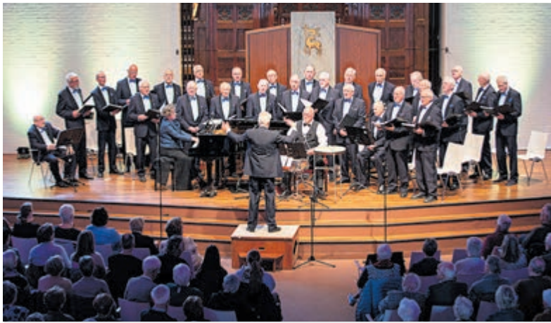
Laatste concert Con Amore in uitverkochte Open Hof kerk.

ting die al jaren kunstzinnige cursussen aanbiedt en waarvan het bestuur over enkele jaren wil stoppen. Samen met Ben Steeman van de SESAM Academie gingen aanwezig in gesprek over bestuursopvolging en continuïteit. In een open en interactieve sessie werden ervaringen gedeeld en ideeën uitgewisseld, variërend van het betrekken van leden bij taken tot het actief zoeken naar nieuwe bestuursleden via netwerken en organisaties. Naast het inhoudelijke programma was er ruimte voor korte presentaties uit het veld. Zo werd de tentoonstelling Vrouwelijke vrijheid – traditie en verbeelding toegelicht, en presenteerde een student van de HKU een initiatief om jonge makers in de regio beter met elkaar te verbinden. De muzikale omlijsting werd verzorgd door Lifeblood, die met een akoestische set zorgde voor sfeer tijdens de inloop en afsluitende borrel. Met een diverse groep aanwezigen, waaronder vertegenwoordigers van verenigingen, kunstenaars, de gemeente en culturele instellingen, laat het Cultuurcafé zien dat de behoefte aan ontmoeting en samenwerking binnen het culturele veld groot is.