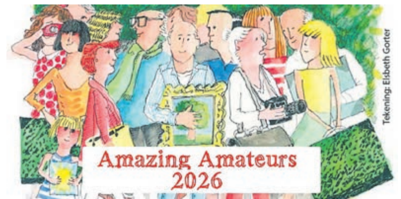
Amazing Amateurs Aalsmeer. Tekening door Elsbeth Gorter

huis in Aalsmeer. Hier worden alle kunstwerken samen gepresenteerd. De tentoonstelling biedt ruimte aan verschillende kunstvormen. Of je nu schildert, tekent, fotografeert, met textiel werkt of op een andere manier creatief bezig bent: iedereen kan meedoen. De expositie is te zien van 13 mei tot en met 5 juni en is vrij toegankelijk voor bezoekers. Tijdens deze periode kan het publiek stemmen op een favoriet kunstwerk. Deelnemers maken daarmee kans op zowel een publieksprijs als een jury-prijs. Aanmelden voor deelname is mogelijk vanaf 6 april. Meer informatie over deelname, de voorwaarden en het inschrijfformulier is te vinden op www.skca.nl .