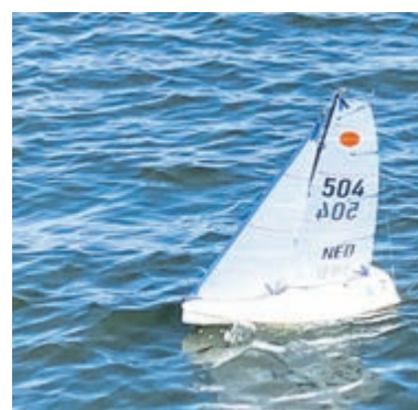
Kampioenschap Open Klasse Micro Magic Zeilen.

kelijk was de goede klassering van Rian Rubingh (ook uit Eindhoven) met haar 504 en rode stip in het zeil, die kans zag om fraai derde te worden en daarmee de Aalsmeerse routinier Klaas Spaargaren bedwong. Naast de klassementsprijzen werd er ook een sportiviteitsprijs uitgereikt. Die ging terecht naar de Belgische zeilvrienden, die er vice versa meer dan 400 kilometer rijden voor over hadden en naast hun excellente accessoires ook het zeilen steeds beter onder controle krijgen. Surf naar micromagic.nl voor details en leuke foto's van het rc-zeilen.