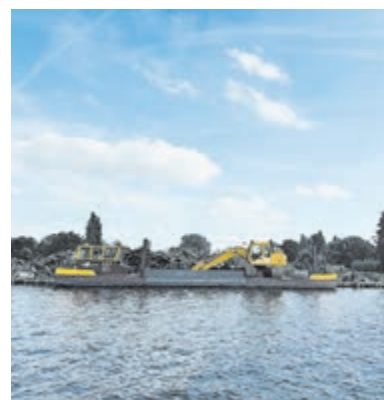
Snoeiboot op de Westeinderplassen.