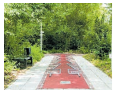
Midgetgolfclub opent het nieuwe seizoen.

komt dit jaar zelfs met twee teams op de proppen in District West. De eerste wedstrijd is op 19 april op de bogri banen te Ridderkerk. Nieuwsgierig geworden? Kom dan zeker langs om meer te horen over de vereniging, het wedstrijdspel en de mogelijkheden om lid te worden. Of je nu recreatief wilt spelen of graag wat serieuzer met de sport aan de slag wilt; iedereen is welkom. Na de paasdagen is de midgetgolfbaan iedere woensdag, zaterdag en zondag geopend van 13 tot 17 uur.