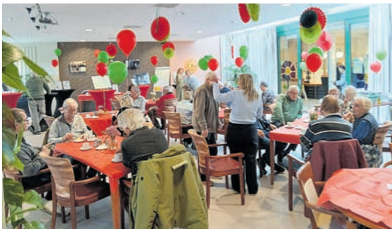
Gouden jubileum Tafeltje Dek Je feestelijk gevierd.

Bakwedstrijd en muziek Zaterdag 11 april kan vanaf 11.00 uur een film over hoe er vroeger door bakkers gebakken werd, mogen de zelfgebakken broden van meel van de Leeuw voor de wedstrijd ingeleverd worden en gaat een vakjury proeven, ruiken, voelen en de lekkerste broden kiezen. Uitreiking van deze prijzen is om 13.00 uur. Tussen 14.30 en 16.00 uur zorg Aalsmeers Harmonie voor een vrolijk 'molenconcert' en om 17.00 uur zit het draaien en malen erop en mag een gokje gewaagd worden hoeveel omwentelingen de molen heeft gemaakt in 30 uur.