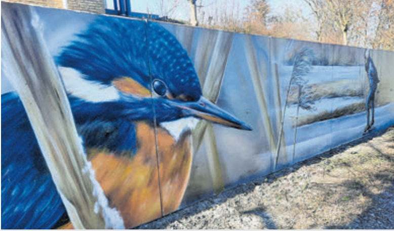
Vissen en schaatsen op de Poel, een boot vol seringen, aardbeien, de bloemenveiling, Fort Kudelstaart en natuurlijk de Watertoren maken onder andere onderdeel uit van de mooie, 65 meter lange muurschildering van de hand van Sander Bosman en Joost Zwanenburg.