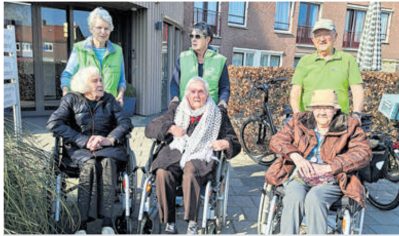
Rolstoelwandelen met vrijwilligers van Stichting SAM.

Rijsenhout Dorpshuis Rijsenhout Werf 2 Plus Werf 15