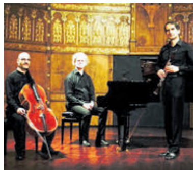
Trio Ermerant komt zaterdag optreden in Aalsmeer.

teerde al van Istanbul tot Amsterdam en weet telkens opnieuw het publiek te raken. In dit programma staat uiteraard Bach centraal, in sfeervolle bewerkingen voor klarinet, maar ook muziek van door hem geïnspireerde componisten komt uitgebreid aan bod. Er zullen werken te horen zijn van onder andere F. Poulenc, B. Kovács, C.P.E. Bach, A. Pratsinakis en H. Villa-Lobos. Het klassieke concert in De Oude Veiling aan de Marktstraat wordt georganiseerd door Stichting KCA en het Flower Art Museum en begint om 20.00 uur, zaal open vanaf 19.30 uur. Entree: regulier tarief 20 euro, met FAM vriendenkaart 17,50 euro (maximaal twee kortingskaartjes