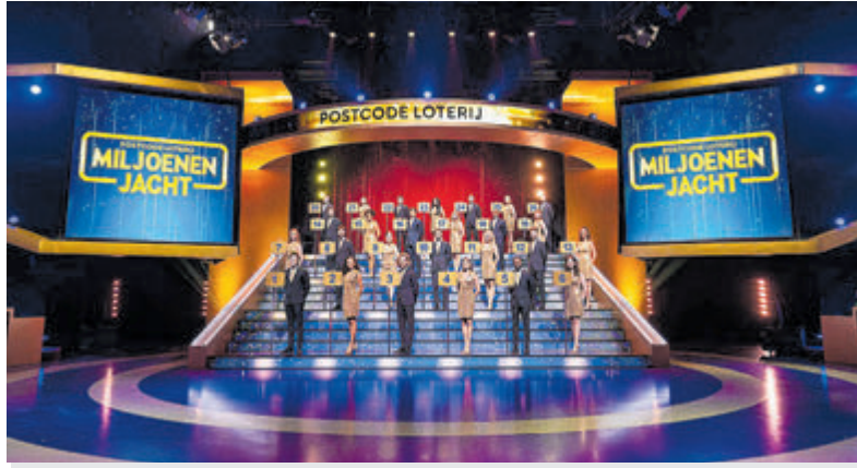
Kofferspel tijdens Postcode Loterij Miljoenenjacht.