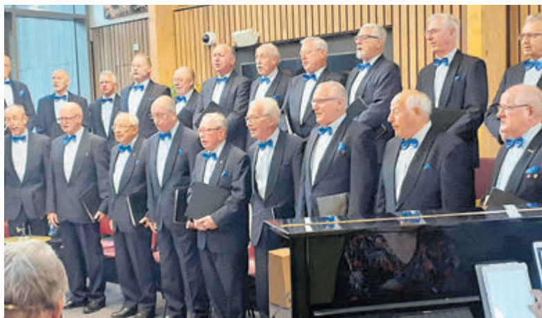
Con Amore tijdens een concert in Zwanenburg.