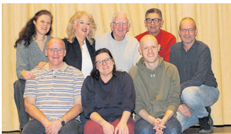
De groep spelers van Toneelvereniging Kudelstaart.

Kudelstaart - Op 17, 18 en 19 april presenteert Toneelvereniging Kudelstaart 'Momenten van Geluk' in theater 't Podium, het Dorpshuis van Kudelstaart. Het belooft weer een prachtige voorstelling te worden vol verwickelingen en stof tot