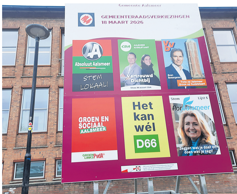
Verkiezingsbord voor het Raadhuis.

25.322 inwoners naar de stembus, maar slechts iets meer dan de helft (50,6%) kwam het rode potlood ter hand nemen. Er werden totaal 12.715 geldige stemmen uitgebracht. De lokale partijen deden het landelijk vooral goed, ruim 30% van de lokale partijen zagen het aantal zetels stijgen. Ook Aalsmeer schaarde zich achter lokaal, Absoluut Aalsmeer werd de grootste met zes zetels. In Aalsmeer willen zes fracties zich de komende vier jaar in gaan zetten voor de gemeente en haar inwoners: Absoluut Aalsmeer, CDA, VVD, GroenLinks/PvdA, D66 en FlorAalsmeer. Laat uw/jouw voorkeur niet verloren gaan en stel deze