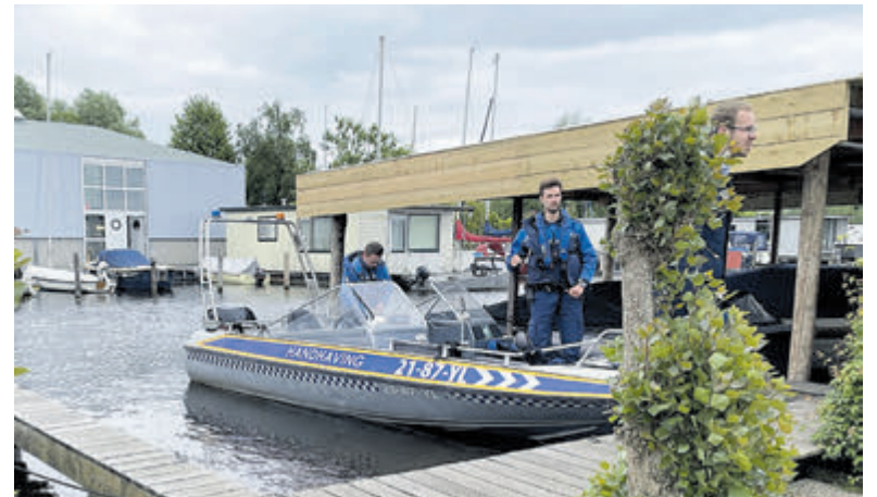
Aanpak overlast op en rond de Westeinderplassen.

De nieuwe aanpak gaat eind volgende week van start. Vooraf wordt op verschillende locaties een tekstkar geplaatst om bezoekers te informeren over de intensievere handhaving. Inwoners kunnen overlast melden via de Fixi app of website. Vermeld daarbij de locatie, een omschrijving van de overlast en eventueel een foto. Zo komt de melding direct bij de juiste afdeling terecht. Bel bij spoed of een nood situatie altijd 112.