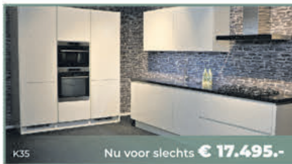
K35 Nu voor slechts € 17.495.-