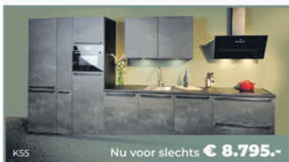
K55 Nu voor slechts € 8.795.-