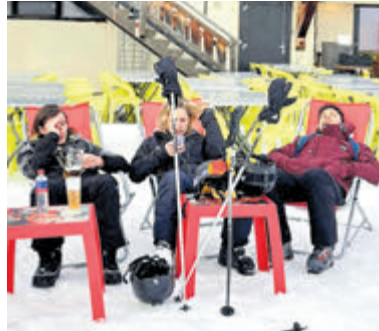
Optredens zes band tijdens de viering van 10 jaar Bandbrouwerij.

Lifeblood is onderhand geen onbekende naam meer in het bandjes circuit. Optredens op Bandjesavond, in de Feesttent tijdens de feestweek, voor 3FM en zelfs in de grote zaal van