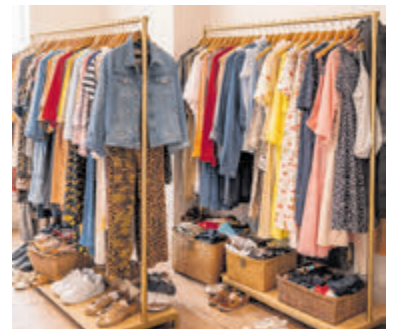
Lionsclub Ophelia organiseert 2e kans kledingmarkt.

rekenen op een gevarieerd aanbod, aantrekkelijke prijzen en een gezellige sfeer. Of je nu op zoek bent naar een mooie aanvulling op je garderobe of gewoon gezellig wilt rondkijken: iedereen is van harte welkom.