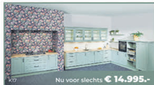
K17 Nu voor slechts € 14.995.-