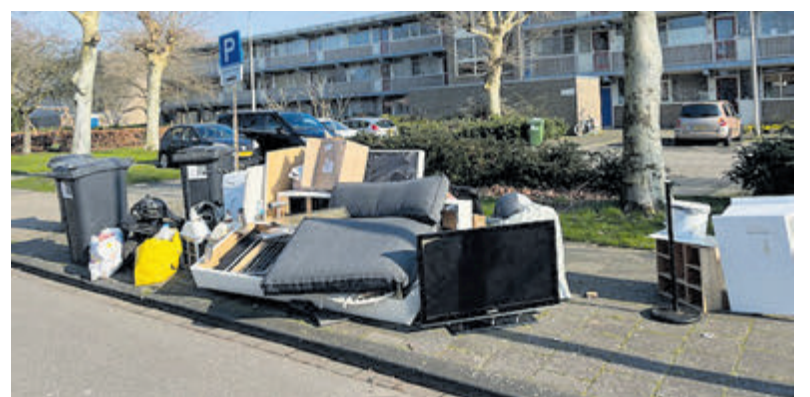
De groeiende berg afval in de Einsteinstraat.

Misschien handig om deze nieuwkomers uit te leggen dat grof vuil zelf weggebracht moet worden naar Meerlanden in Rijsenhout en het bedrijf pas spullen komt ophalen na overleg." De buurtbewoner raadt ook aan om deze informatie in meerdere talen te verschaffen. De aanwezigheid van het grof vuil in de Einsteinstraat is zowel bij de gemeente als bij Meerlanden gemeld.