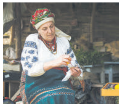
Nieuwe expositie 'Vrouwelijke vrijheid' in Oekraïne.