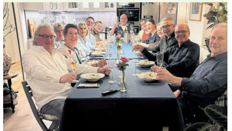
Ententje Truus met 'eigen volk' en 'de kouwe kant'.