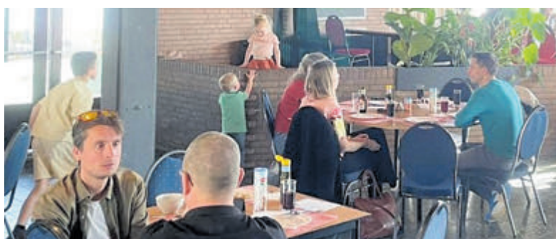
Samen proeven, koken en genieten in Buurthuis Hornmeer.

Op dinsdag 31 maart staat de Buurtmaaltijd op het menu. Vanaf 17.15 uur is de inloop en om 18.00 uur schuiven de deelnemers samen aan. De enthousiaste vrijwilligers koken een verse, gezonde maaltijd die je deelt met burens, vrienden of familie. Een mooie gelegenheid om nieuwe mensen te ontmoeten of gezellig bij te praten. Deelname kost 8 euro per persoon. Aanmelden kan vanaf 17 maart en is verplicht via activiteitenhornmeer@gmail.com of in het Buurthuis tijdens een van de wekelijkse activiteiten. Kijk voor het programma in het Buurthuis op www.stichting-buurthuis-hornmeer.nl