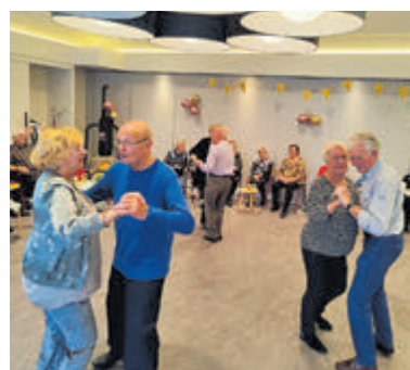
Dansen op donderdag voor 60+ in Irene.

een linedance en een afsluitende gezamenlijke dans op 'terug in de tijd'. Het danspaleis is gezellig, wordt goed bezocht en iedereen van 60+ tot 90+ die van dansen en muziek houdt is welkom. De eerst volgende datum zou 2 april zijn maar is door omstandigheden verplaatst naar donderdag 9 april. Inloop vanaf 14.15 uur, afsluiting om 15.45 uur. Bijdrage 2 euro inclusief hapje en drankje