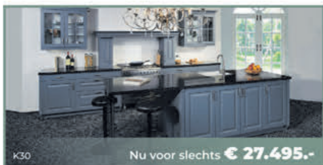
K30 Nu voor slechts € 27.495.-