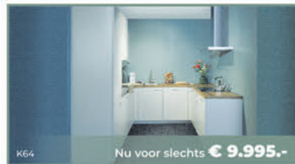
K64 Nu voor slechts € 9.995.-