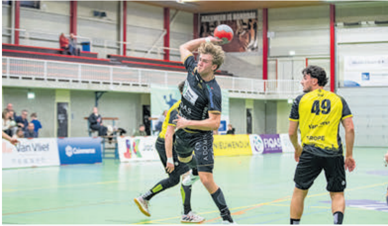
Heren 1 HV Aalsmeer thuis in De Bloemhof tegen Houten.