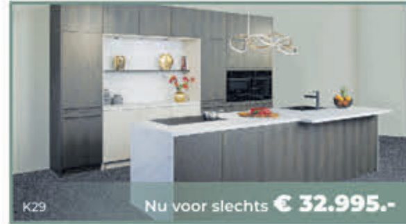
K29 Nu voor slechts € 32.995.-