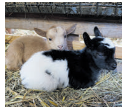
De geitjes Harley en Hailey.

kunnen ze gauw buiten het boerderijterrein gaan verkennen.