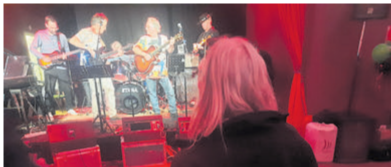
Voetjes van de vloer tijdens optreden Hobo String Band.