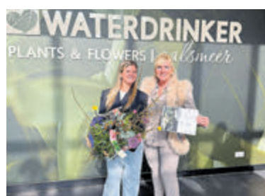
Een feestcommissie-lid van Waterdrinker reikt de cheque uit aan Stichting Ouderen Aalsmeer.

medewerkers die dit mogelijk hebben gemaakt, hartelijk danken. We gaan weer vooruit kijken voor dit jaar, om met deze mooie financiële start opnieuw een leuk evenement voor onze (eenzame) ouderen te gaan organiseren." Het evenement gaat plaatsvinden in het najaar, wat, waar en hoe wordt later bekend gemaakt.