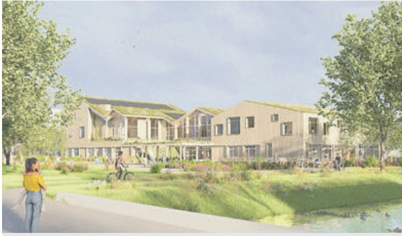
Impressie nieuw Kindcentrum in Aalsmeer Oost (aangeleverd).