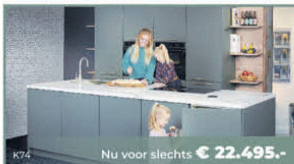
K74 Nu voor slechts € 22.495.-