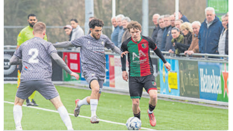
Veel publiek tijdens de wedstrijd FCA 1 tegen SJC.