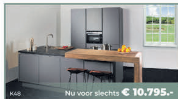
K48 Nu voor slechts € 10.795.-