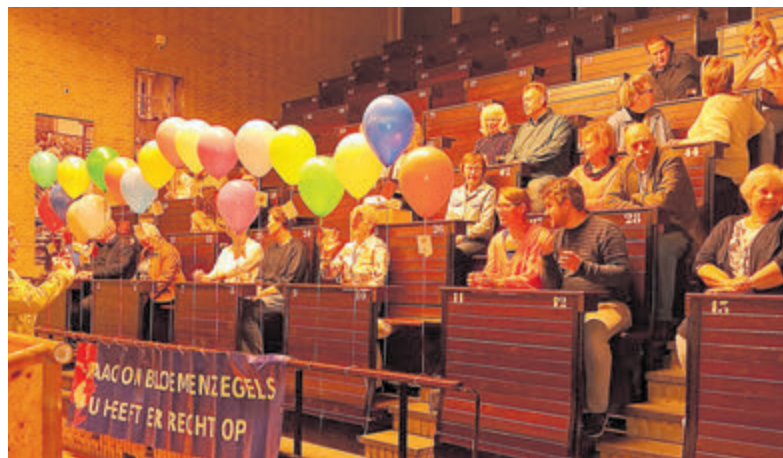
De winnaars van de eindejaarsactie van de Bloemenzegelwinkeliers in de vrolijk versierde veilingzaal van The Beach.