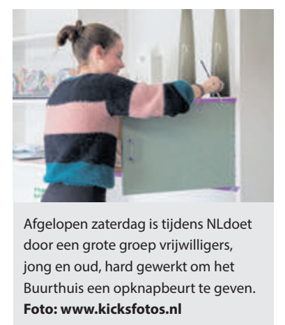
Afgelopen zaterdag is tijdens NLdoet door een grote groep vrijwilligers, jong en oud, hard gewerkt om het Buurthuis een opknappbeurt te geven.