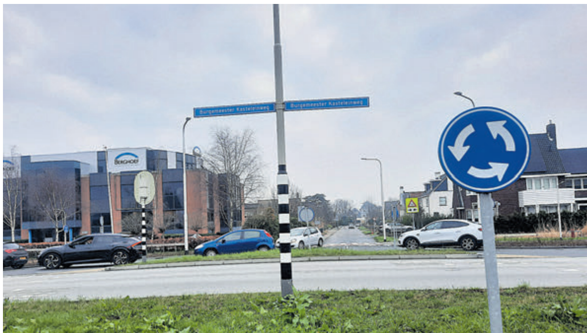
Onlangs zijn de naamborden 'Burgemeester Kasteleinweg' geplaatst bij de rotonde in de Dorpsstraat.