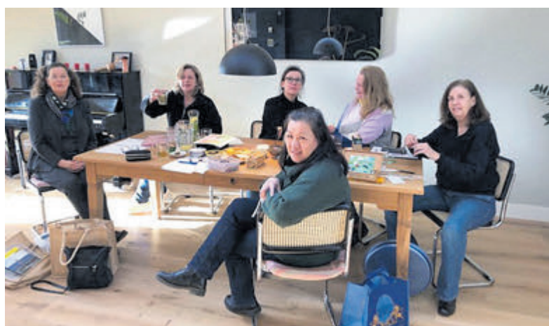
Enkele leden van het Geluksteam tijdens de eerste bijeenkomst.