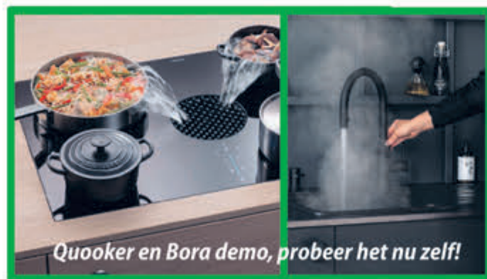
Quooker en Bora demo, probeer het nu zelf!

KEUKEN warenhuis.nl 55 JAAR Keukenervaring f i p You Tube