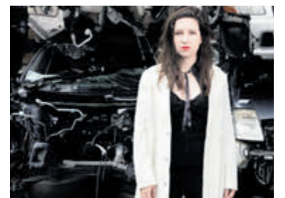
Cabaret van Lotte Velvet in Bacchus.

huidige veranderende omstandigheden. De voorstelling op 18 maart in cultureel café Bacchus in de Gerberastraat begint om 20.30 uur (zaal open vanaf 20.00 uur). Kaarten kunnen gereserveerd worden via de website van KCA; ticketshop. Aan de zaal kan ook met pin betaald worden, maar om teleurstelling te voorkomen wordt aangeraden om vooraf kaarten te kopen.