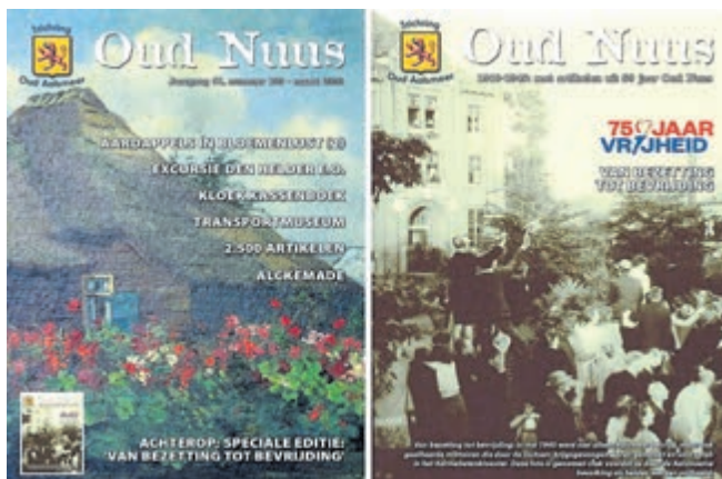
De voorkant van Oud Nuis en de omslag van 'van bezetting tot bevrijding': samen gebundeld.

de Fotogroep graag met u in contact komen. In november heeft Fotogroep Aalsmeer het jubileumjaar afgetrapt met een fraaie expositie en wil in het najaar het jubileumjaar afsluiten met de fototentoonstelling '60 centraal'. Het idee is om 'alles en iedereen' met de leeftijd van 60 jaar op de foto vast te leggen. Door in ar-