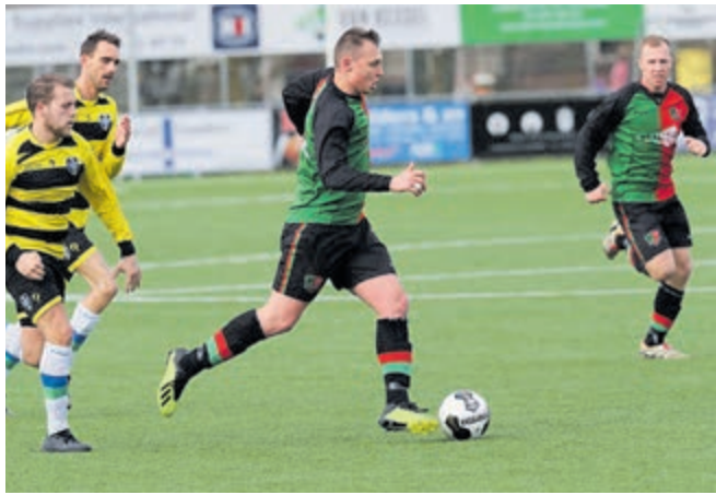
Op zondag 1 maart kon langs de lijn gestaan worden bij FC Aalsmeer en RKDES Kudelstaart. De beide eerste teams speelden thuis. De supporters van FC Aalsmeer zagen hun 'cluppie' tegen Sporting Leiden gelijk spelen. Eindstand: 2-2. RKDES kreeg aan de Wim Kandreef Nicolaas Boys op bezoek. Helaas moest Kudelstaart dit keer haar meerdere erkennen in de ploeg uit Nieuwveen. Er werd verloren met 0-3.