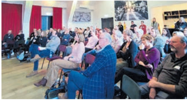
AndersAmstelland heeft het hart op de juiste plek