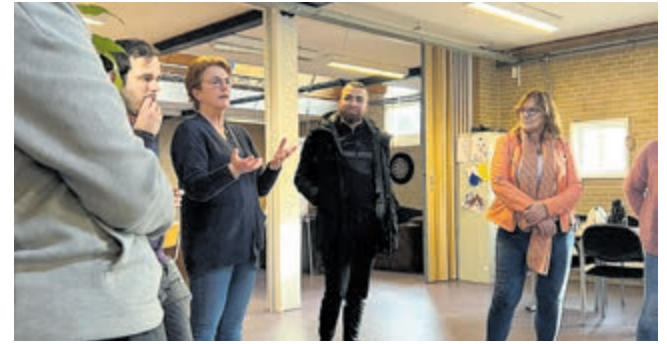
Gemeenteraad op werkbezoek bij jongerenwerk gro-up