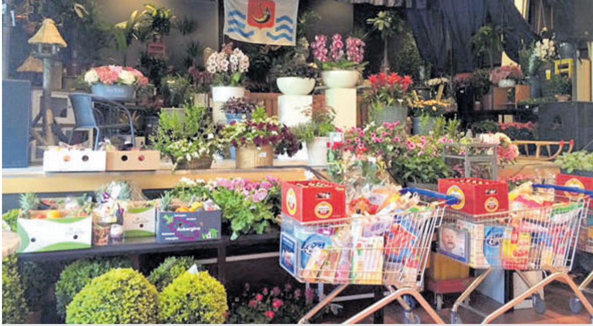
Een greep uit de kavels die bij een eerdere veiling voorbij kwamen.