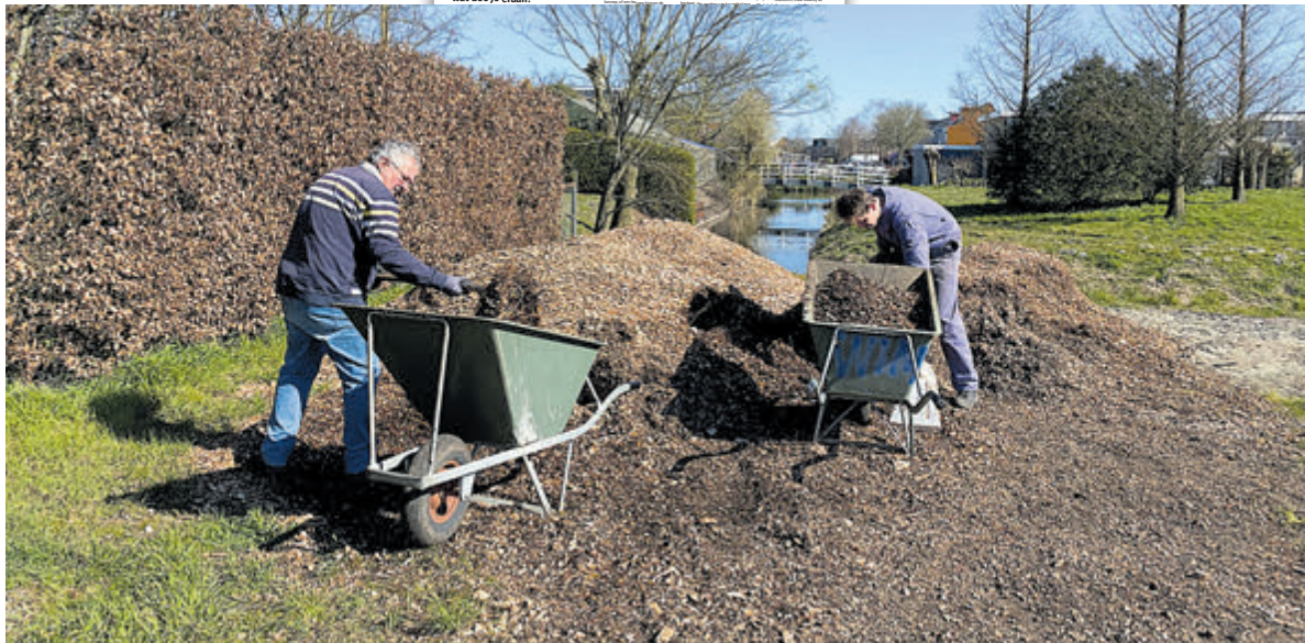
Bij het Voedselbos in Kudelstaart is veel werk aan de winkel. Op vrijdag wordt deelgenomen aan NLdoet en worden vrijwilligers gevraagd voor onder andere het schilderen van de container en het opvullen van de paden met houtsnippers.