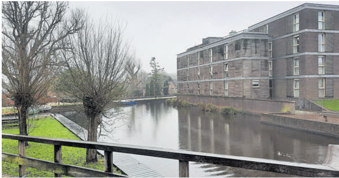
De woontorens aan het Drie Kolommenplein in het Centrum, waar vooral veel senioren wonen.