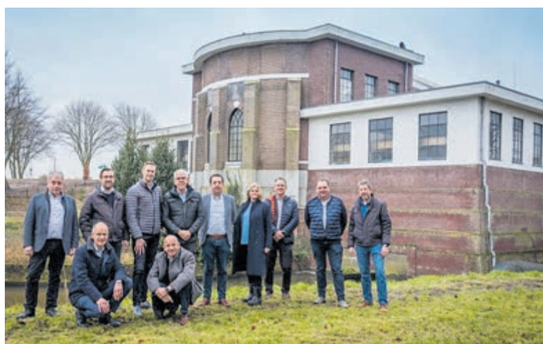
Samenwerkingsovereenkomst getekend bij gemaal Leeghwater.