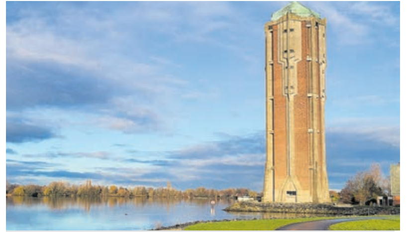
Ochtendgloren bij de watertoren.

En niet onbelangrijk: Dit jaar 2023 bestaat de Vereniging van Aalsmeerse Bloemenzegelwinkeliers 70 jaar en dit jubileum gaat met allerlei leuke acties met spaarders gevierd worden. Vraag om Bloemenzegels, u heeft er recht op!