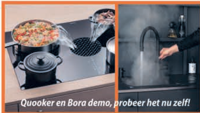
Quooker en Bora demo, probeer het nu zelf!