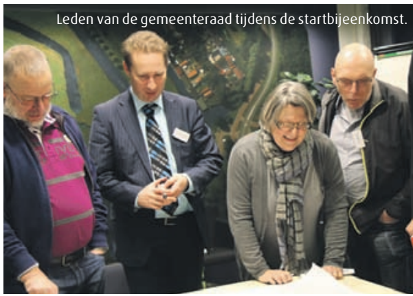
Leden van de gemeenteraad tijdens de startbijeenkomst.

gesprek met betrokken inwoners, ondernemers en vertegenwoordigers van maatschappelijke instellingen.