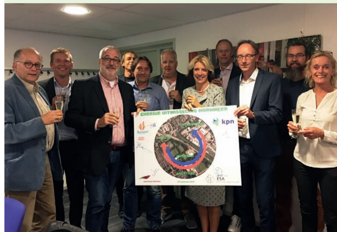
Ondertekening Energie-uitwisseling Hornmeer