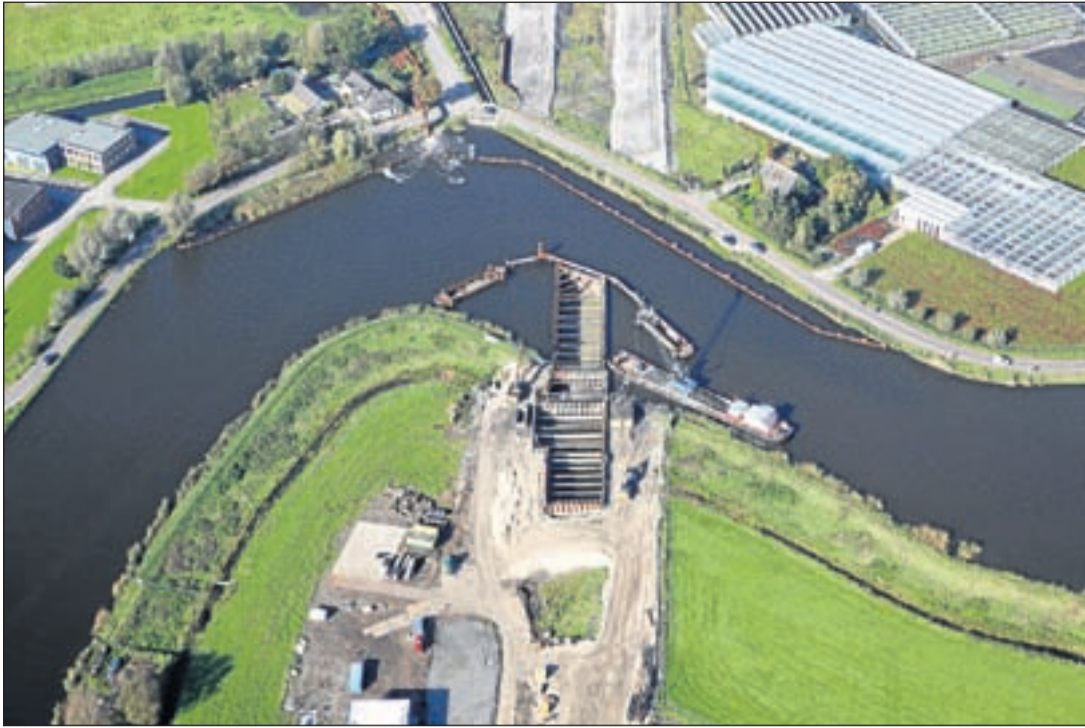
Ontgraving van het eerste deel van het aquaduct aan de Rondeveense kant. Boven aan de foto de overkant van de Amstel met de Hollandse Dijk en het afvoeren van water door het gemaal. Ook is het vervolg van het tunneltracé zichtbaar.