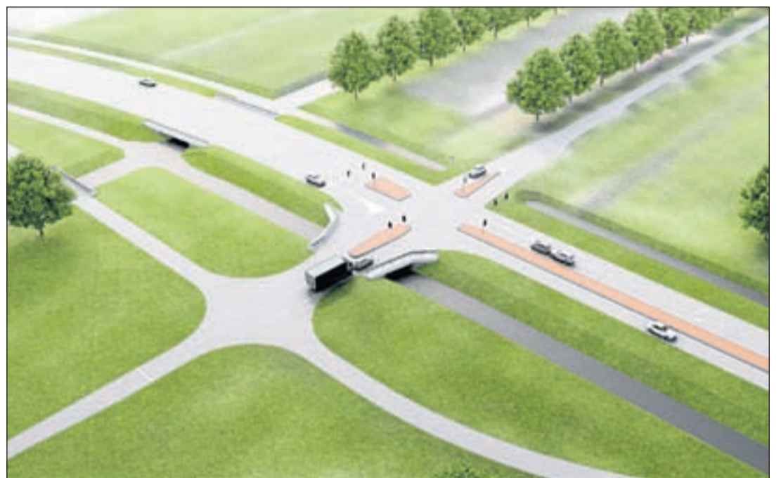
Artistieke impressie van de kruising met de Van Geijnweg zoals die na oplevering eruit ziet. De weg rechtsboven is vanuit de richting van de Tienboerenweg. In het midden de N201 die aan de linkerkant van de foto afbuigt richting het aquaduct.