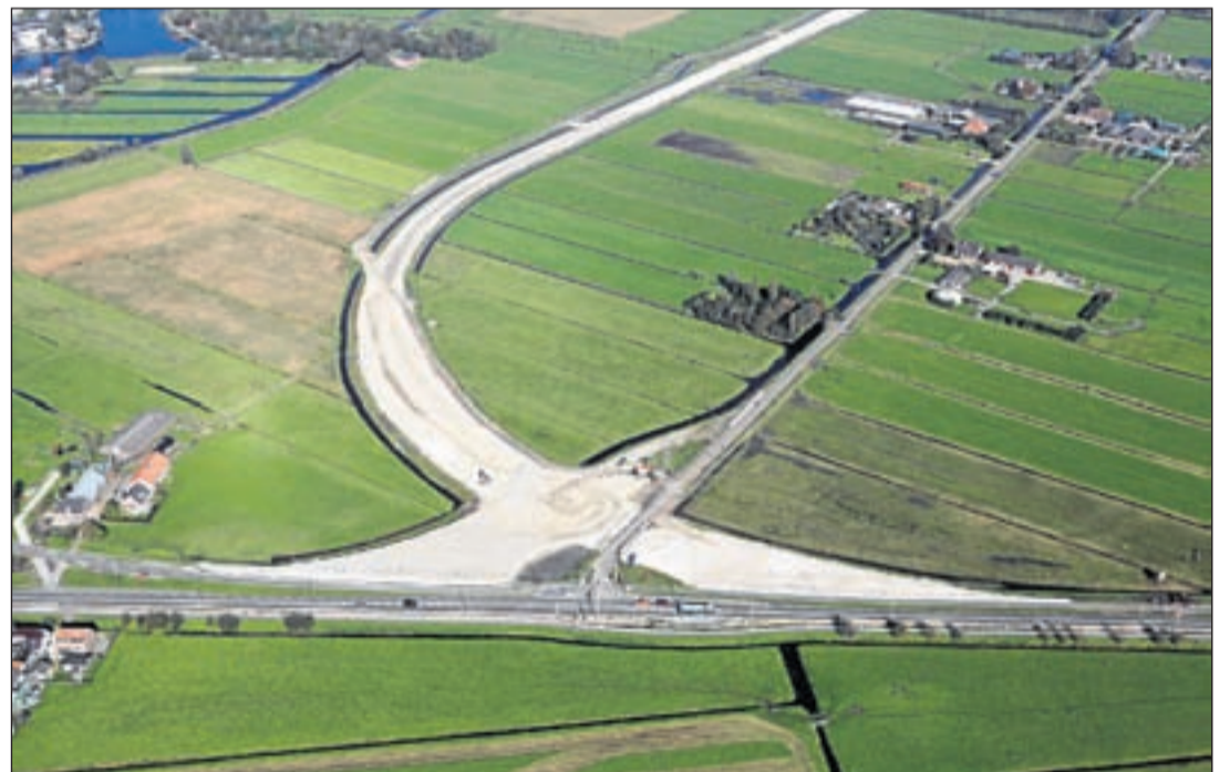
Beneden de huidige N201 en de kruising met de Tienboerenweg (schuinrechts). De N201 naar links is richting Amstelhoek, naar rechts richting Mijdrecht. De korte aansluiting aan de linkerkant op de kruising is die voor de richting stukje Mijdrechtse Zuwe, Amstelhoek en Ringdijk Tweede Bedijking. Naar boven is het tracé van de omgelegde N201 met pal daarnaast de tijdelijke bouwweg. Linksboven in de hoek is nog net de Amstel zichtbaar.