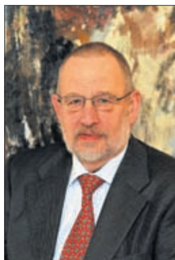
Bijlsma van Gemeente Belangen