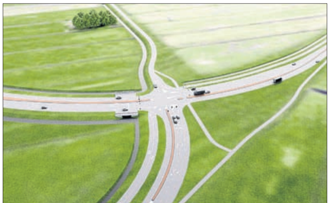
De toekomstige kruising met de Tienboerenweg als een artistieke impressie. Het geeft een enigszins vertekend beeld. Naar boven is de Tienboerenweg, naar rechts de N201 richting Mijdrecht, naar links de omgelegde N201 richting Van Geijnweg en aquaduct. Naar beneden de aansluiting op het bestaande stukje N201 (Mijdrechtse Zuwe) richting Amstelhoek en rotonde bij de Ringdijk Tweede Bedijking. Rechts beneden is het fietspad van Amstelhoek naar Mijdrecht. Pal naast de N201 uit de richting Mijdrecht ligt de busbaan die diagonaal over de kruising dubbelbaans zijn vervolg krijgt richting Amstelhoek/Uithoorn.