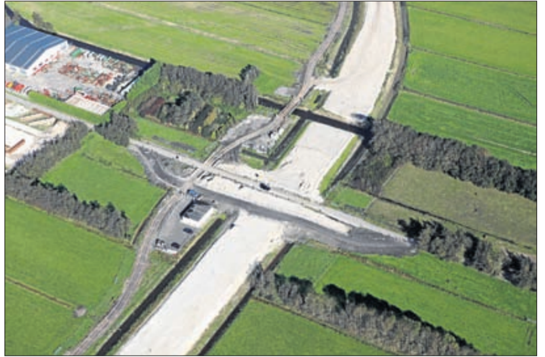
Werkzaamheden aan de N201 ter hoogte van de kruising met de Van Geijnweg. Links in de hoek van de foto het tracé van de N201 de (tijdelijke) bouwweg wat later een landbouwweg wordt. Naar de bovenkant van de foto toe is richting aquaduct.