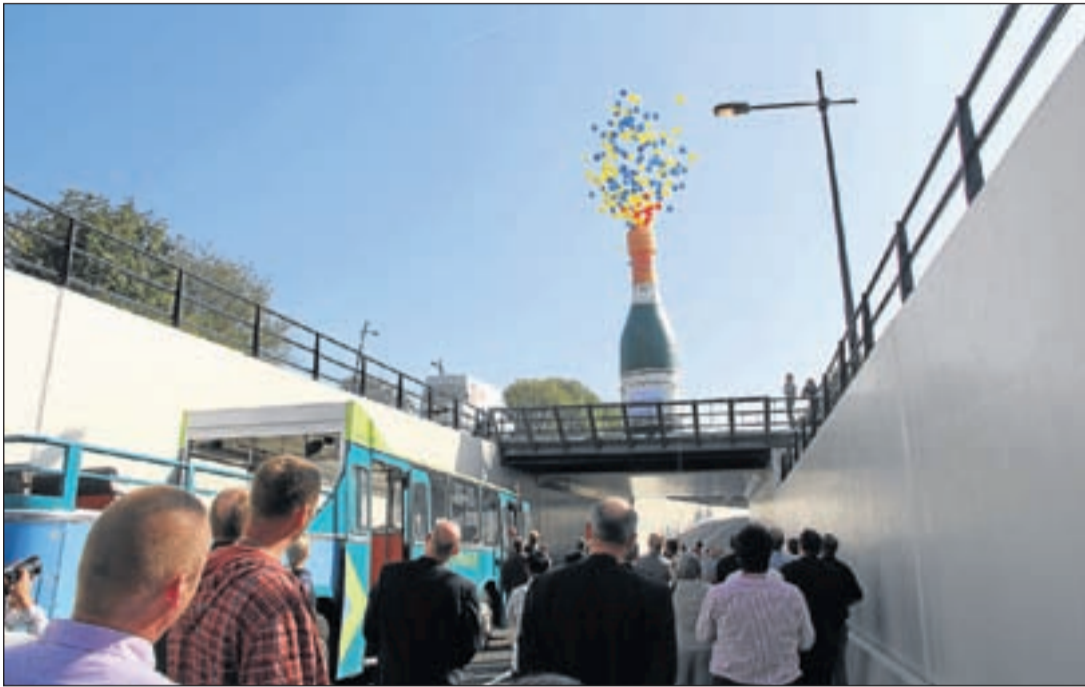
Vrije busbaan feestelijk in gebruik genomen