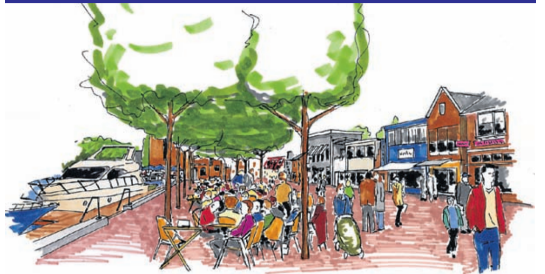
Voorstelling nieuwe jachthaven bij de Thamerkerk