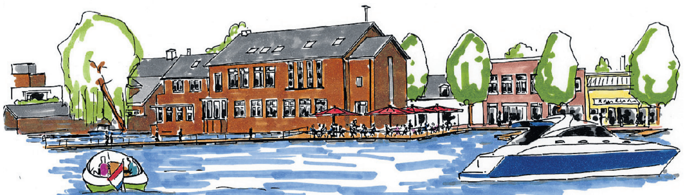
Achter het oude gemeentehuis komt een nieuwe aanlegsteiger met promenade