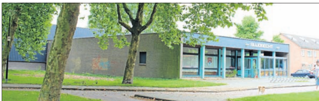
Het oude zwembad Blijdrecht in Mijdrecht

dig mogelijk te verkopen, waarbij prijs en passendheid met de stedenbouwkundige uitgangspunten de componenten van die afweging zullen vormen. In de zomerperiode zullen de onderhandelingen gestart worden met de partijen die op basis van bovengenoemde componenten de beste bieding gedaan heeft", aldus het college.