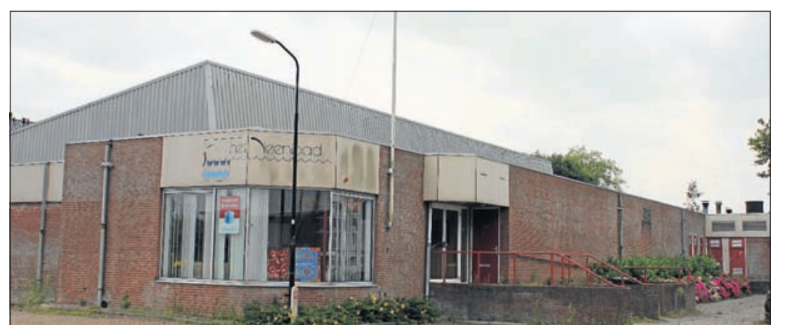
Het oude Veenbad in Vinkeveen