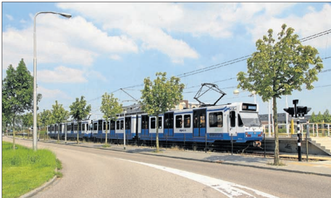
Wordt de sneltram vanuit Amstelveen-West doorgetrokken naar Uithoorn? Het is nog maar 5 km over de oude spoorbaan.