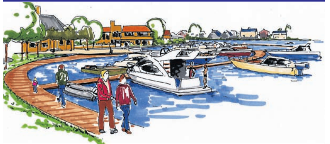
Zo gaat de passantenhaven tussen busbrug en oude gemeentehuis eruit zien