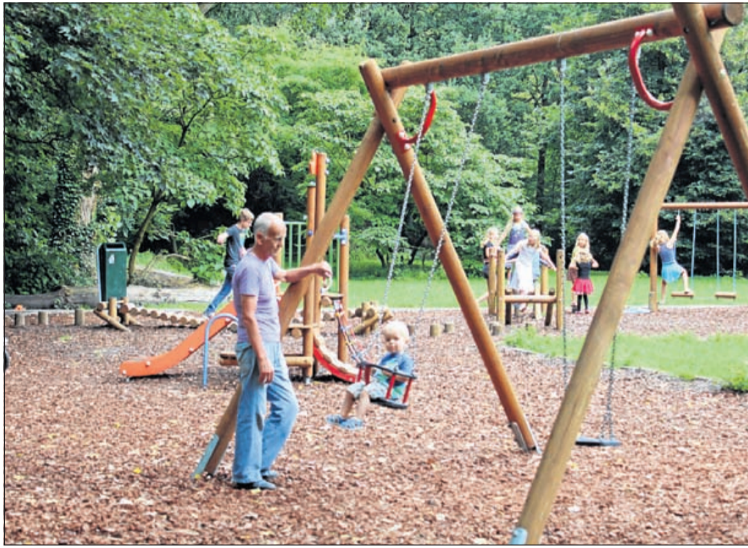
Het speelparkje bij De Meijert