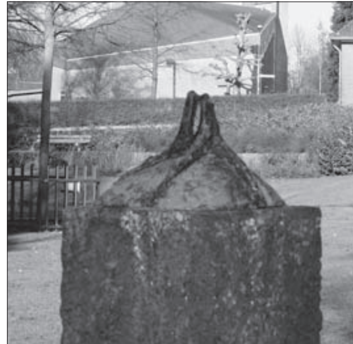
Alleen de twee poten van de reiger staan er nog. De rest van het koperen beeld werd door nog onbekende bronsgievers gestolen.