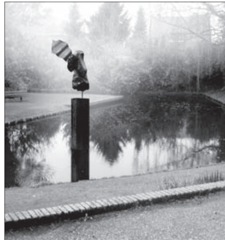
Het nieuwe beeld Vuelo de Aqua

Het beeld is gemaakt van een combinatie van Serpentin opaal steen en Cortenstaal. Het beeld wordt nu in het water geplaatst.