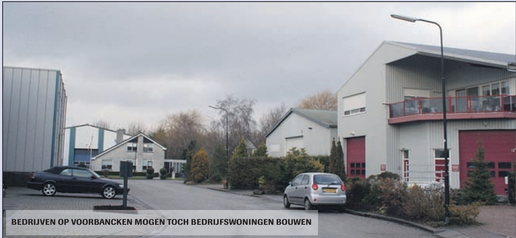
BEDRIJVEN OP VOORBANCKEN MOGEN TOCH BEDRIJFSWONINGEN BOUWEN