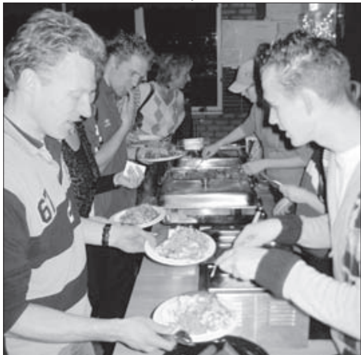
Ruim 900 euro voor KiKa met stampactie bij Atlantis

Mijdrecht - Korfbalvereniging Atlantis heeft afgelopen zaterdag voor de tweede maal dit seizoen een actie gehouden om geld in te zamelen voor KiKa. Sinds vorig jaar heeft de selectie van Atlantis zich verbonden aan KiKa en wordt met enkele acties per jaar geld ingezameld voor dit goede doel. Na de Doelpuntenponsoractie aan het begin van het seizoen werd nu de KiKa-Stampactie gehouden. Voorafgaand aan de stampactie werden tijdens de wedstrijden van Atlantis 1 en Atlantis 2 KiKa-beren verkocht. Ook kon het publiek voor één euro in de toetoe een gokje wagen op de uitslag en de topscoorder van de wedstrijd van Atlantis 1. Er werden bijna 50 bieren verkocht, en ruim 50 mensen deden mee aan de toto. Na de wedstrijden was het tijd voor de stampactie. Voor 750 euro kon gekozen worden uit andijviestampot of boerenkoolstampot met daarbij een gehaktbal of een stuk rookworst. Zeventig mensen hadden zich opgegeven, waardoor het een gezellige drukte was in de Atlantiskantine. Tijdens de maaltijd werd de uitslag van de toto bekend gemaakt. Omdat niemand de uitslag goed voorspeld had, werd de prijs (een mooie KiKa-beer) verloot onder de personen