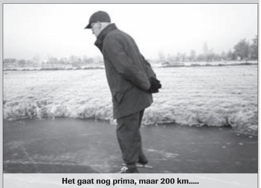
Het gaat nog prima, maar 200 km.....

73. HEBT U ALTIJD GELOOFD IN EIGEN KUNNEN? Ja, dat wel. Van huis uit zijn we doordouwers. Rijden tot je er bij neervalt. En ik voelde me ook in de tweede 100 kilometer nog sterk genoeg.