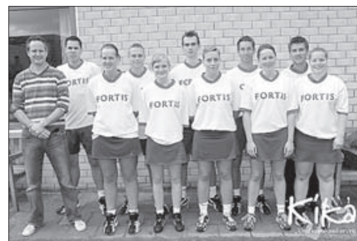
Atlantis 2 verliest van EKVA