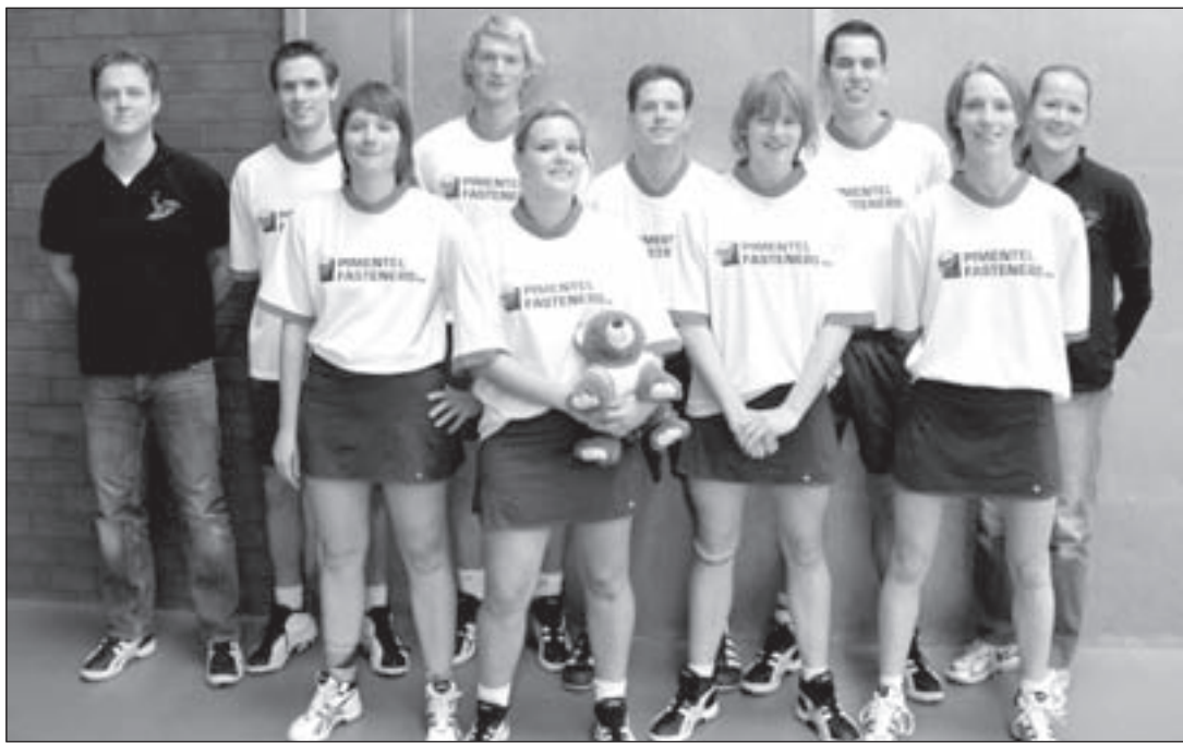
Atlantis 1 verliest van Oosterkwartier