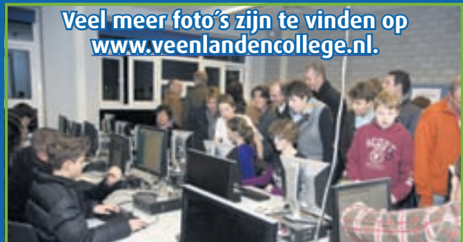
Veel meer foto's zijn te vinden op www.veenlandencollege.nl .

Wat op de leerlingen van groep acht bijzonder indruk maakte was de enthousiaste manier waarop de leerlingen van het VeenLanden College hen lieten zien hoe er op hun school gewerkt wordt. Bijgaande foto's geven hiervan een impressie.