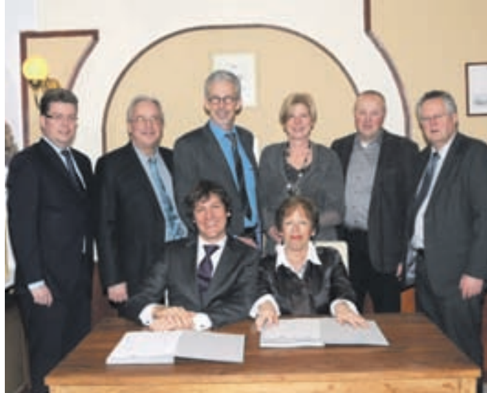
De colleges van B&W van Aalsmeer en Uithoorn.