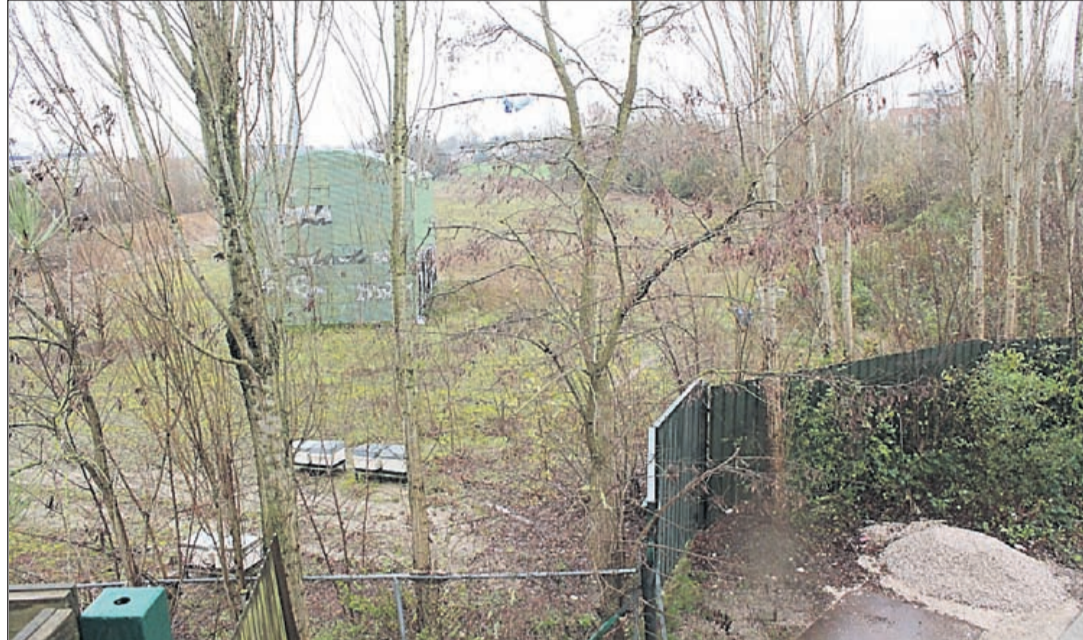
Woningen op de Stationslocatie? Naast een coffeeshop?