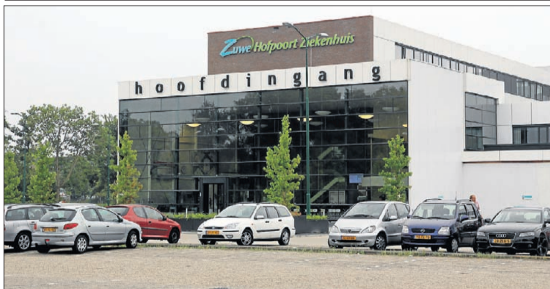
Geen nachtelijke huisartsenpost meer in het Zuwe Hofpoort ziekenhuis en na tien uur 's avonds is per 1 november a.s. ook de dienstapothek gesloten. Wat volgt?