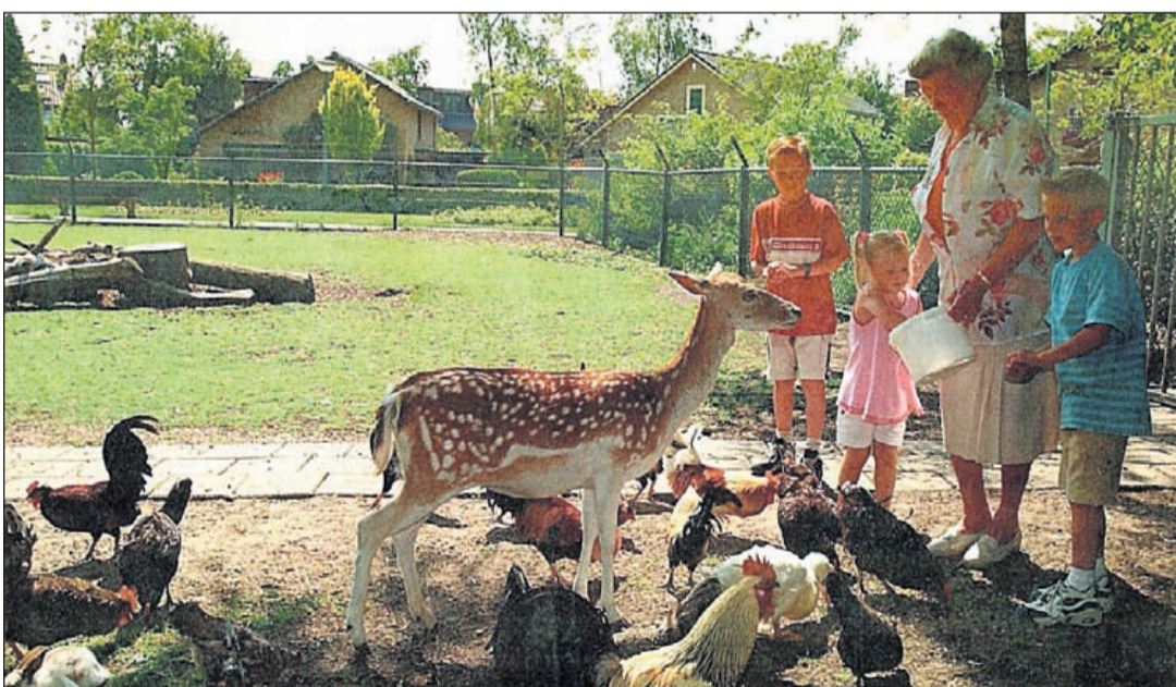
Kinderen mochten er soms bij zijn als de dieren werden gevoerd