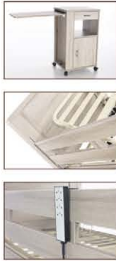
Houston ledikant 90x200cm eiken naturel, licht noten, grijseiken, rustiekeiken