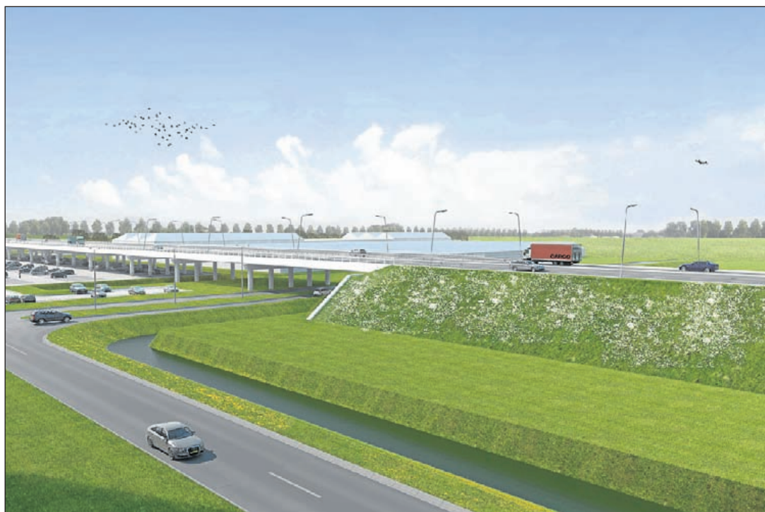
Het een na laatste deel van de N201 bij Schiphol-Rijk met o.a. de fly-over wordt op 15 december opengesteld voor het verkeer. Rest alleen het aquaduct bij Amstelhoek nog (Illustratie: Projectbureau N201+).