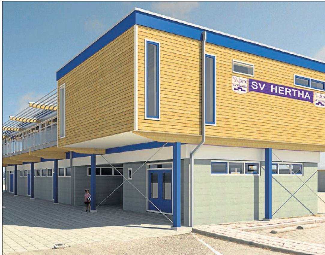
Voorbeeld van de nieuwe kantine op de bestaande kleedaccommodatie langs het hoofdveld (Ref: Casper van Gorselen & Martijn Zeldenrijk)

INFORMATIE: ☎ 0297-581698 ☎ 06-53847419 ✉ VERKOOPMIJDRECHT@MEERBODE.NL