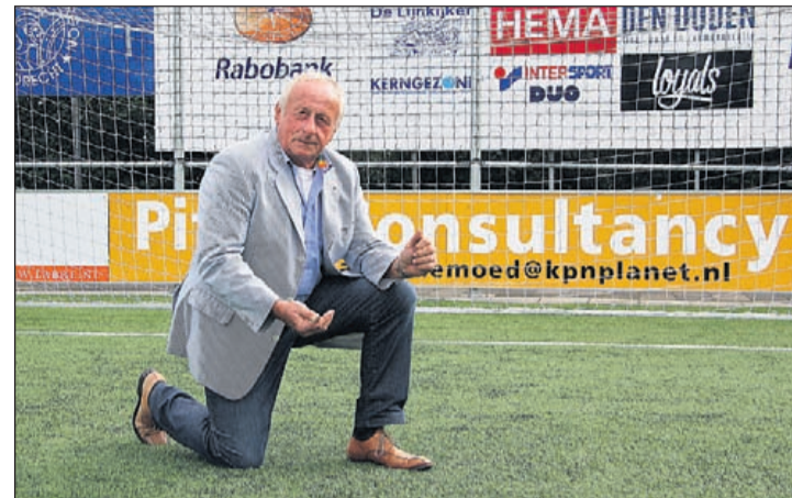
Voorzitter sportvereniging Argon