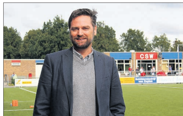
Voorzitter sportvereniging CSW