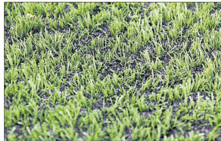
De velden liggen vol met de veelbesproken korrels