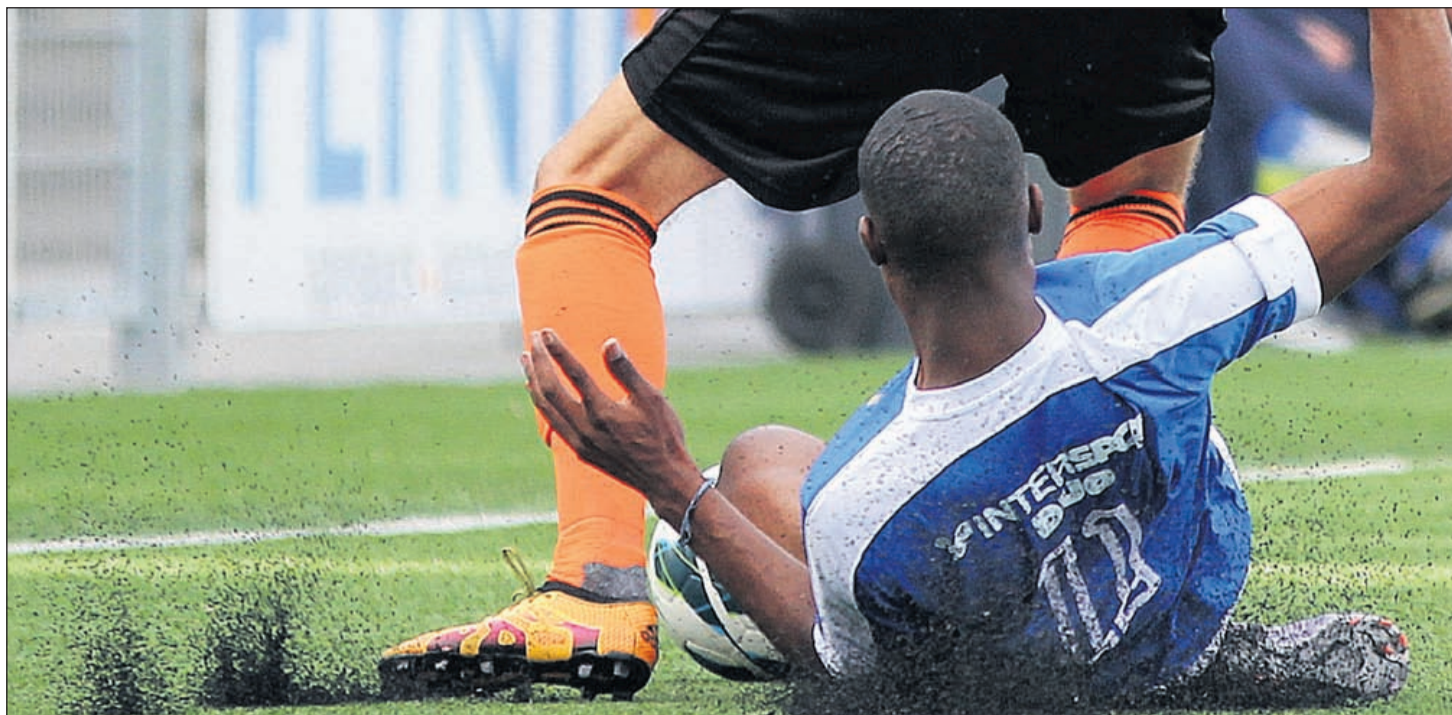
Ook tijdens het voetballen vliegen de korrels omhoog