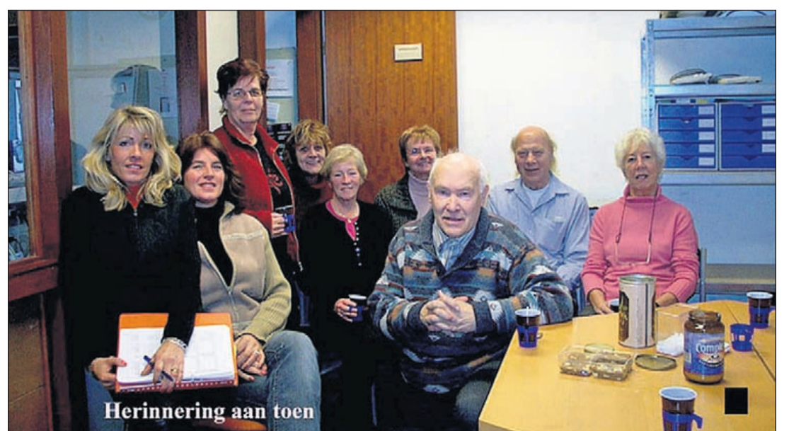
Herinnering aan toen

Voor inlichtingen en aanmeldingen: telefonisch 0297-282938 of 06 5345 4196 of per email naar seniorweb-drv@gmail.com. Meer info vindt u op www.seniorwebderonden.nl