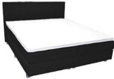
Boxspring 'Victoria' van €995,- voor €695,-