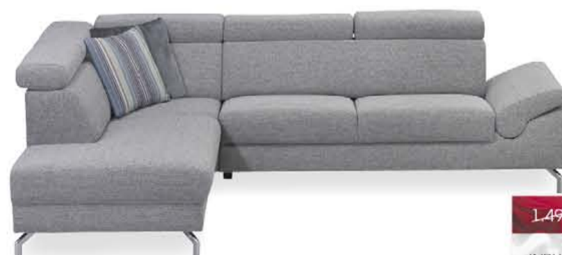
Montèl Urban hoekbank in stof zoals afgebeeld, excl. sierkussens.

1.399,- 1.299,- NU MET INRUILVOORDEEL 1.199,-