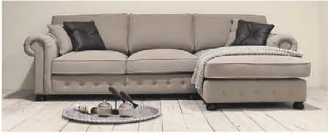
Loungebank 'San Remo'