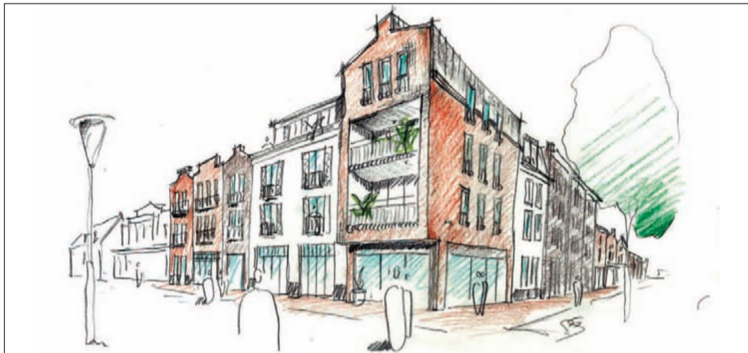
Impressie van de zes grondgebonden woningen aan de Julianalaan achter het nieuwe winkelcentrum Molenhof (Ref. Groosman Partners)

Het mocht niet zo zijn. Kort na zijn aftreden als voorzitter werd hij ernstig ziek, echter hij streefde voor zijn leven zoals hij schaakte, vol inzet, en het lukte. Begin april verscheen hij weer op de clubavonden, hij was meteen weer in alles geïnteresseerd en vertelde dat hij zich beter voelde dan hij zich sinds lang gevoeld had. Zijn tegenstanders hebben dit geweten, want met een onwaarschijnlijke serie van 6 overwinningen, 2 remises en 0! verliespartijen deed hij iets wat maar weinigen presteren. Helaas de strijd werd verloren, de ziekte keerde via een omweg terug en vrijdag 20 september 2013 viel onze koning om.