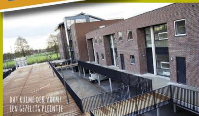
DAT RIJME DEK VOORMT EEN GEZELLIG PLEINTJE