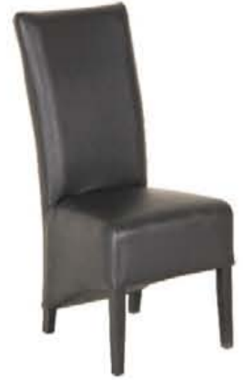
Stoel 'Margot' van €119,50 voor €79,50