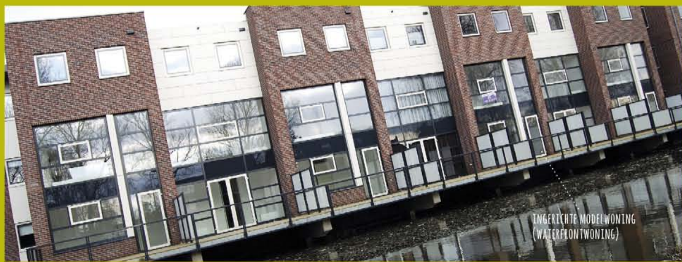
TINGERICHTE MODELWONING (WATERFRONTWONING)

ALLE WONINGEN ZIJN AFGEBOUWD, DUS U KUNT