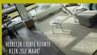
HEERLIJK LICHTE RIJME - KIJK ZELF MAAR!

EEN KIJKJE NEMEN KAN OOK OP: WWW.DEGRUTTOMIJDRICHT.NL