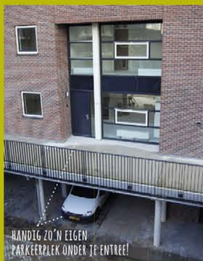
HANDIG 20'N EIGEN PARKEERPLEK ONDER JE ENTREE!