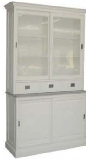
Vitrinekast 'Lin 02' van €1.195,- voor €695,-