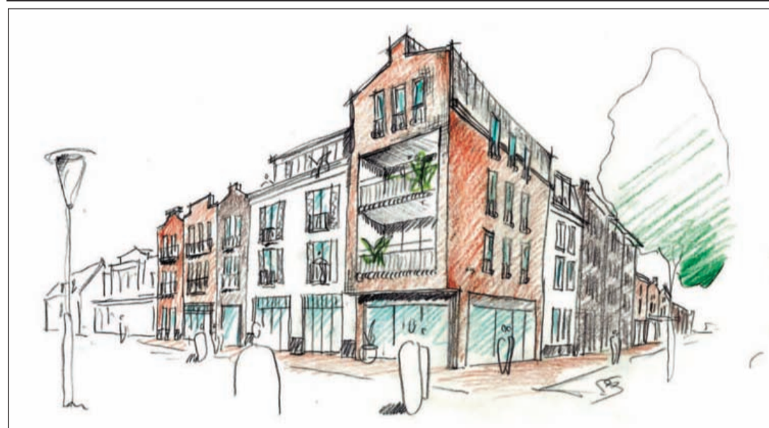
Het aangepaste ontwerp van Passage Molenhof (zicht hoek Dorpsstraat/Kerkvaart) is op 24 september door Hoogvliet Beheer gepresenteerd