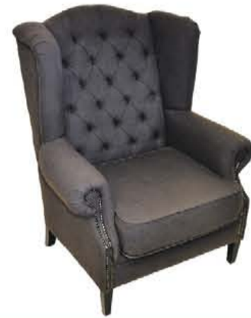
Fauteuil 'Henk' van €595,- voor €395,-