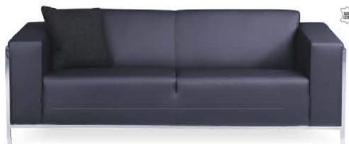
Montèl Hopper 2-zits in actieleder zoals afgebeeld, excl. sierkussen.

1.199,- 1.099,- NU MET INRUILVOORDEEL 999,-