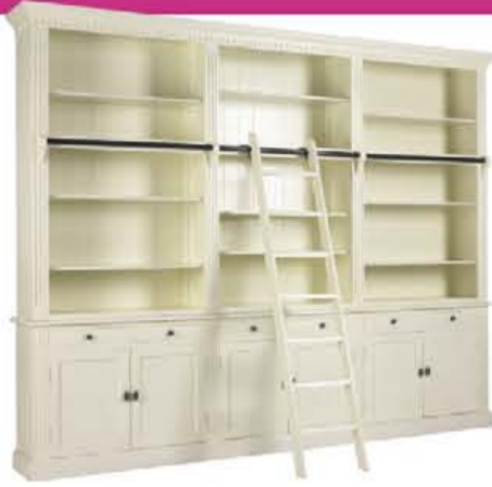
Private Library van €2.995,- voor €1.395,- Beschikbaar in diverse maten en kleuren