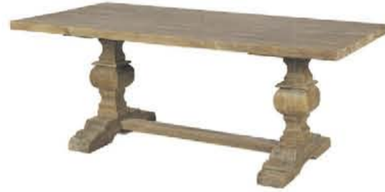
Eettafel 'Bart' vanaf €855,-