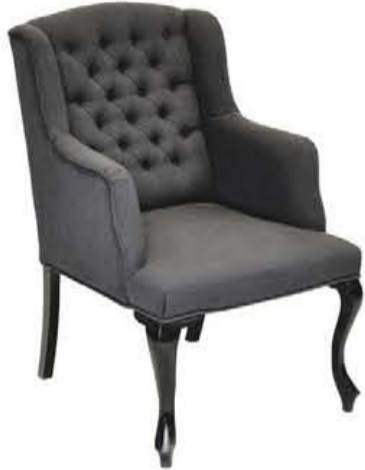
Stoel 'Victoria' van €349,- voor €199,-