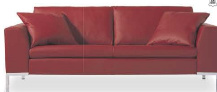
Montèl Once 2-zits in leder zoals afgebeeld, excl. sierkussens.

1.499,- 1.299,- NU MET INRUILVOORDEEL 1.199,-