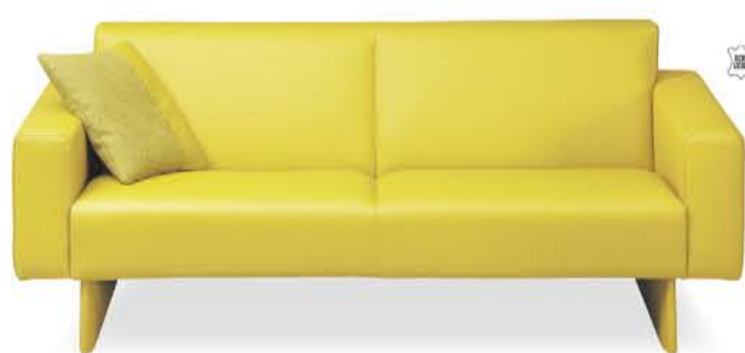
Montèl Retro 2,5-zits in leder zoals afgebeeld, excl. sierkussen.

BIJ AANKOOP VAN EEN NIEUWE MONTÈL BANK JE OUDE BANK NEMEN WE GRATIS MEE BIJ LEVERING VAN JE NIEUWE BANK