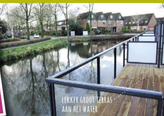
LEKKER GROOT TERRAS AAN HET WATER