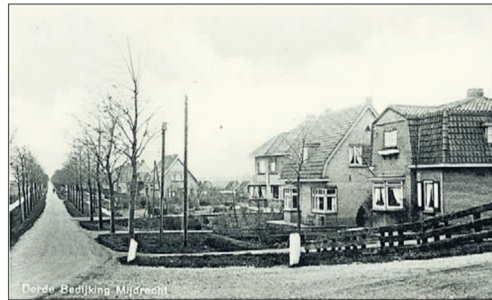
De Hoofdweg in Mijdrecht circa 1940