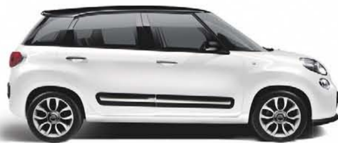
500L V.A. € 17.995,-