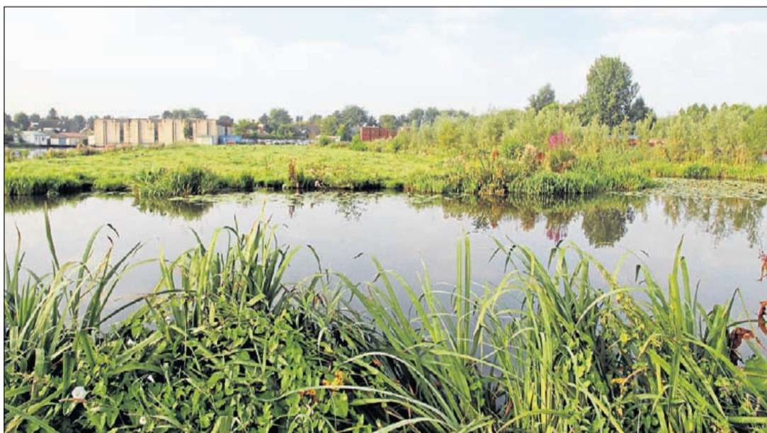
Wordt het landelijke karakter in Wilnis straks aangetast door (te hoge) woningbouw op een stuk grond met nu nog mooie natuur?

INFORMATIE: 0297-581698 06-53847419 VERKOOPMIJDRECHT@MEERBODE.NL