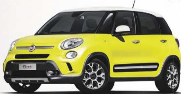
500L TREKKING V.A. € 22.495,-