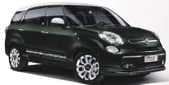
500L LIVING 5-ZITS V.A. € 20.795,- 500L LIVING 7-ZITS V.A. € 21.645,-