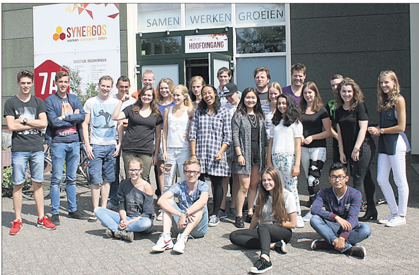
ZomerOndernemers volgden driedaagse training en gaan nu van start met hun eigen bedrijf.

Het idee ZomerOndernemer komt uit Zweden en is de afgelopen jaren succesvol uitgevoerd in Flevoland, Amstelland, Zwolle en het Groene Hart. Deze zomer start het project in acht regio's in Nederland. Afgelopen jaren heeft een aantal nieuwe bedrijven opgeleverd en ook dit jaar zijn de verwachtingen hooggespannen. Er zijn plannen voor: reisbureaus, een loonbedrijf, een typhulp voor mensen met spasme, webshops, een Alpacafarm, oldtimerverhuur, grafisch ontwerp, ICT-oplossingen. En voor een dierenopvang, uitstapjes voor eenzame ouderen, schoolspullenlijn, evenementenbureaus, sieradenverkoop, T-shirt ontwerp, eigen kledinglijn, stoffeerdier, society netwerk en een foodtruck. Meer informatie? Kijk op www.zomerondernemer.nl , www.facebook.com/ZomerOndernemerGH en twitter @zomerongh .