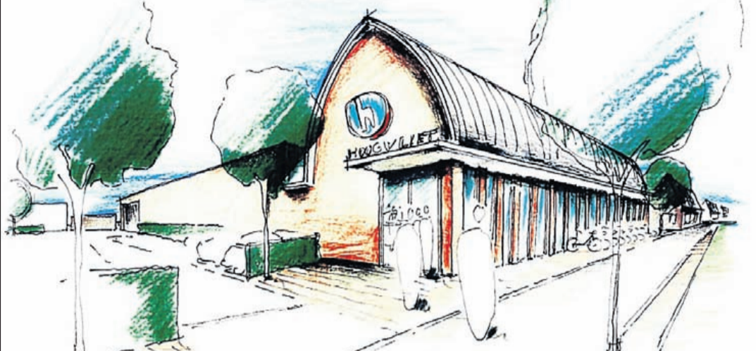
Impressie van de Hoogvliet supermarkt aan de Kerkvaart (Ref.: Groosman Partners architecten)