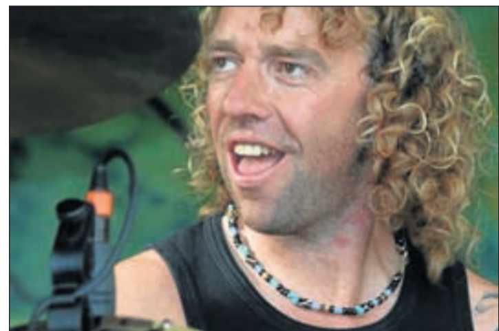
The Deal is te bewonderen bij Drinken en Zo

Kortom: smullen maar. Kom luisteren en voetjes van de vloer, want het enthousiasme wat van deze jongens afstraalt en ten gehore wordt gebracht werkt zeer aanstekelijk. Hun motto is "Those were the days and tonight they will be yours!! We will be Seeing you soon". Er is genoeg te beleven in Uithoorn komende zaterdagavond vanaf 21.00 uur.