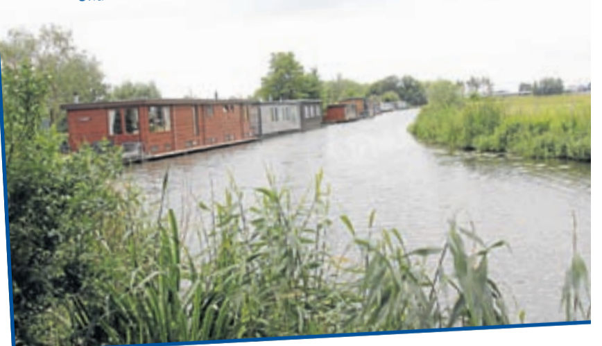
Onderhoud en toegankelijk houden van recreatieve vaarwegen, zoals de Angstel

voorkomen dat dijken onveilig worden, gelden er regels volgens een landelijke norm. Regelmatig worden de dijken getoetst en gecontroleerd of ze nog aan de regels voldoen. Mocht dat niet het geval zijn, dan is er nog geen acuut gevaar. Elke dijk heeft een veiligheidsmarge waardoor er voldoende tijd is om de dijk weer hoog en sterk genoeg te maken. Alleen wist men in 2003 (nog) geen raad met de kenmerken en eigenschappen van uitgedroogde veendijken met de dijkverschuiving in Wilnis tot gevolg. Van die ervaring heeft men nu geleerd.