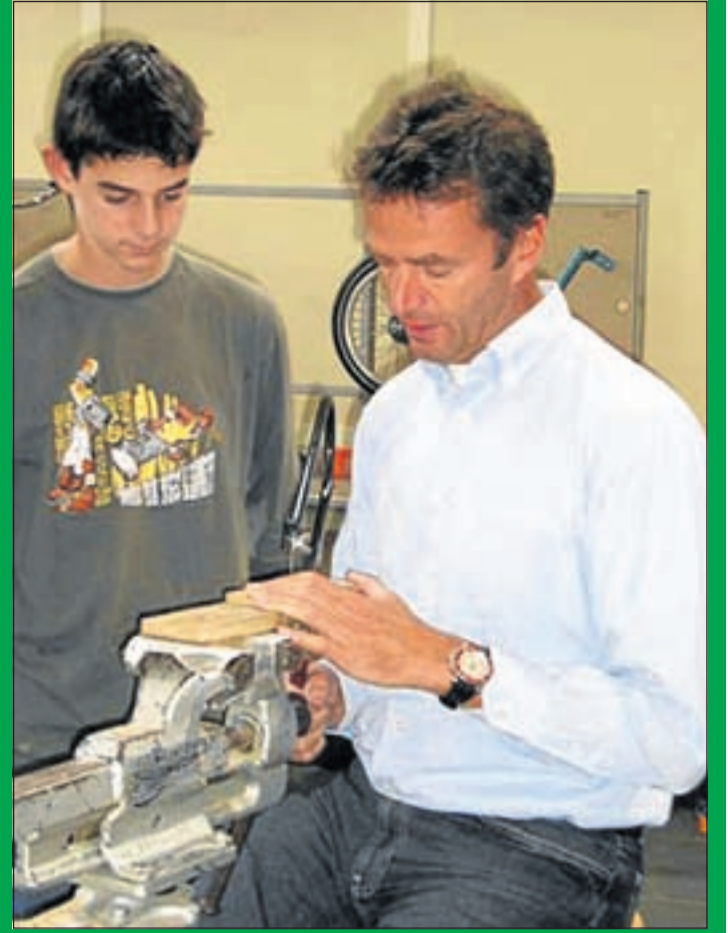
'Kijk, zo doe je dat'. Techniekles houtbewerking.