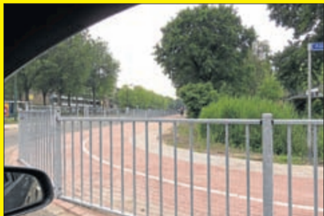
Vijf meter voor de haaiantanden is er nog een klein beetje uitzicht naar rechts, maar nog geen zicht naar links