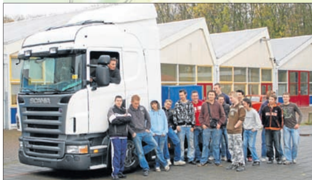
Transport & Logistiek op Thamen