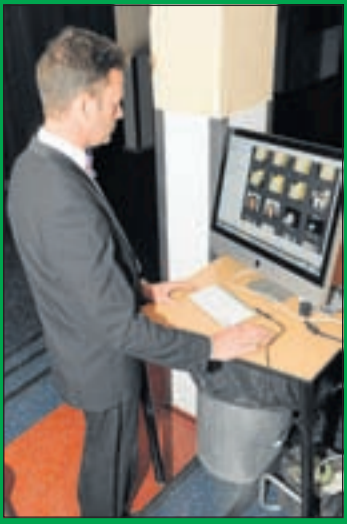
Diploma-uitreiking met theatervoorstelling voor ouders en geslaagden