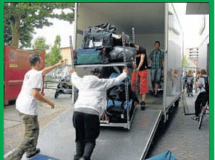
Op kamp met brugklas logistiek