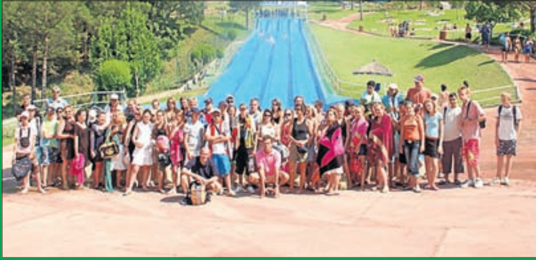
Met de leerlingen op excursie naar Barcelona