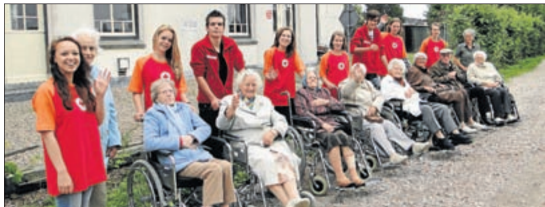
Op de foto: de groep van Zuiderhof wandelt langs het oude Spoorhuis in Vinkeveen!