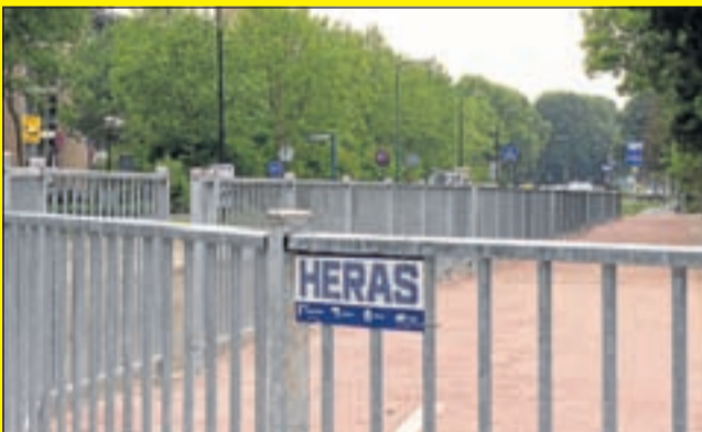
Vrijwel geen zicht naar rechts. Goed is ook één van de zes openingen in het hek te zien.