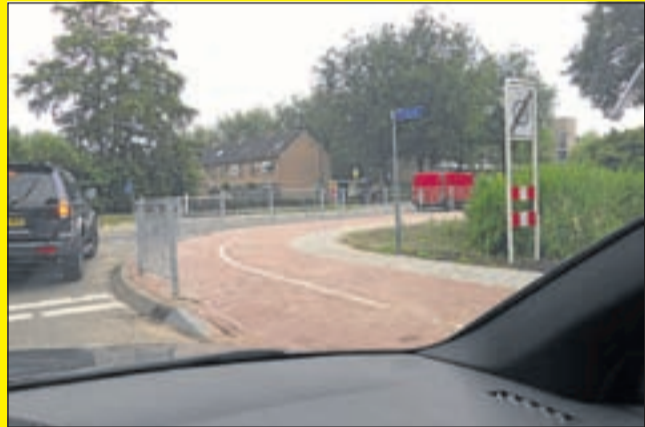
Zo'n 10 meter voor de haaiantanden is het zicht naar rechts goed, maar nog geen zicht naar links