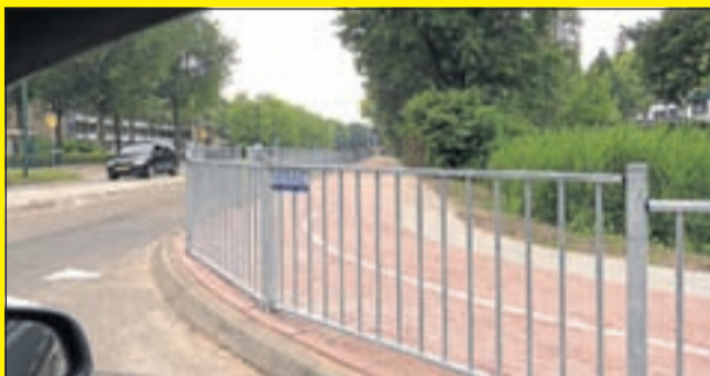
Eenmaal bij de haaiantanden is er goed zicht naar links maar niet meer naar rechts