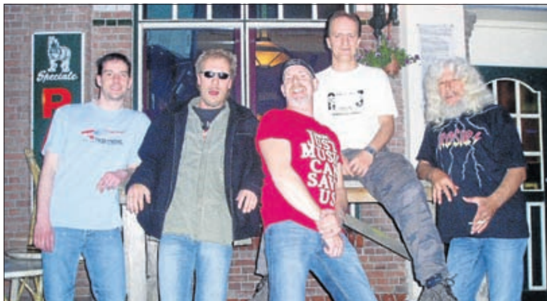
Que Pasa speelt in de Julianalaan