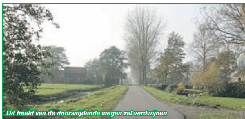
Dit beeld van de doorsnijdende wegen zal verdwijnen