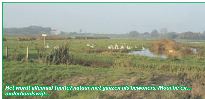
Het wordt allemaal (natte) natuur met ganzen als bewoners. Mooi hé en... onderhoudsvrij!...