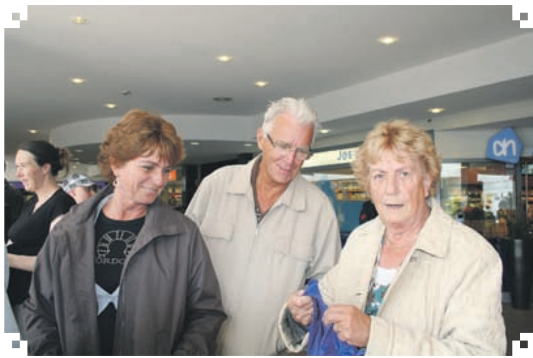
De kleine meid dook de grote ton in en kwam triomfantelijk met een envelop boven