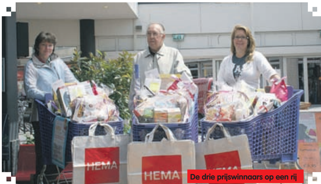
De drie prijswinnaars op een rij