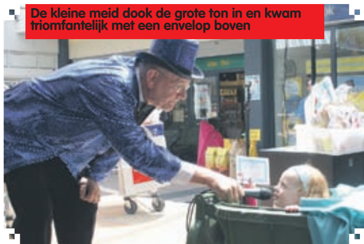
Deze kleine meid moest tweemaal een envelop trekken voor de eerste prijs