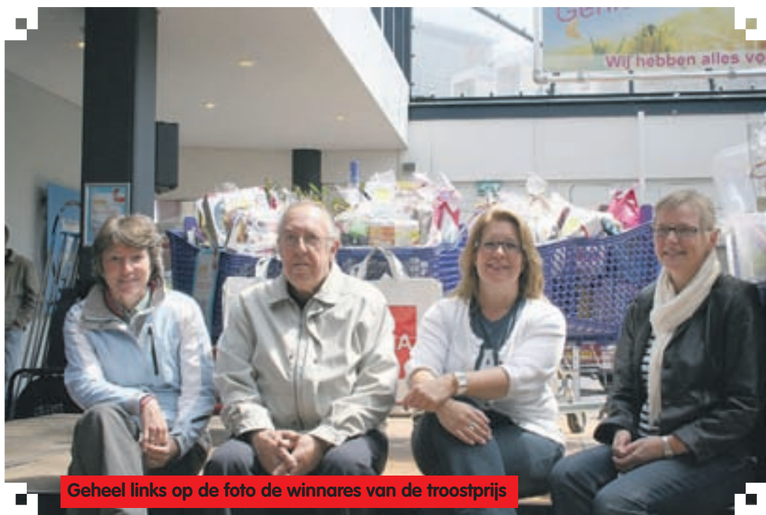
Geheel links op de foto de winnares van de troostprijs