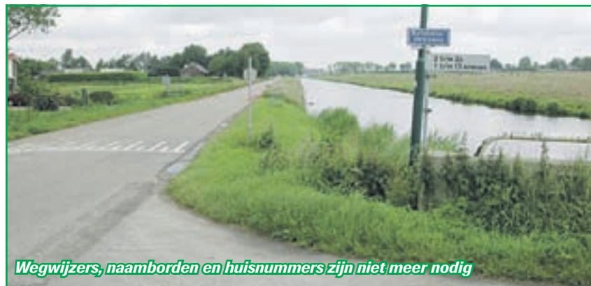
Wegwijzers, naamborden en huisnummers zijn niet meer nodig