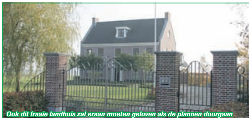
Ook dit fraaie landhuis zal eraan moeten geloven als de plannen doorgaan