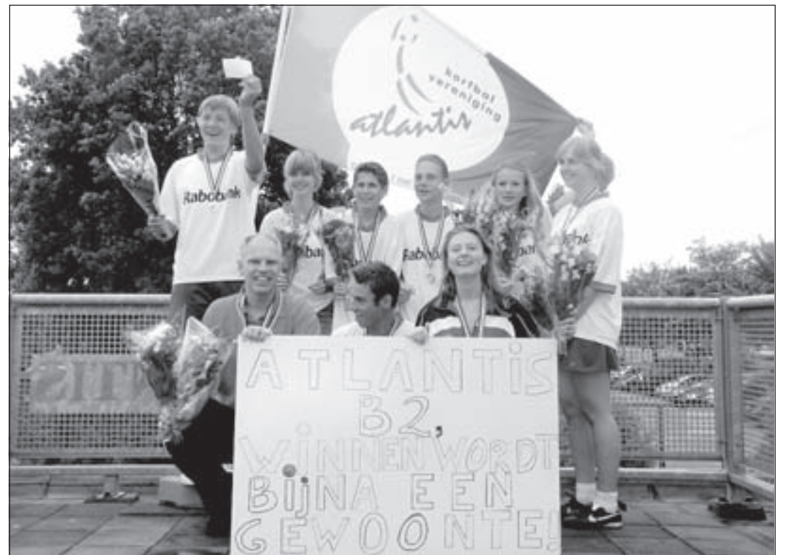
De kampioenen van Atlantis B2

Mijdrecht - Afgelopen zaterdag heeft Atlantis B2, gesponsord door de Rabobank, zijn laatste wedstrijd van het seizoen gespeeld. De strijd was al gestreden. Dit team is voor de derde keer op rij kampioen geworden. Een formidabele prestatie. Tussen neus en lippen door ook nog even een medaille op een toernooi in de wacht gesleept.