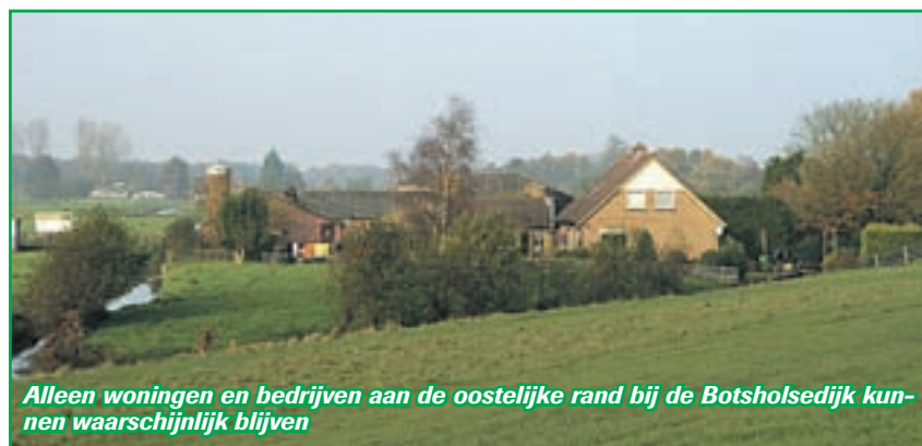
Alleen woningen en bedrijven aan de oostelijke rand bij de Botsholse dijk kunnen waarschijnlijk blijven