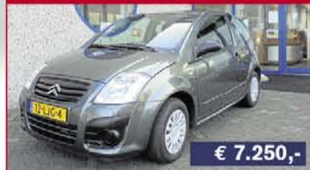
Citroën C2 1.4i Furio, 2010, 22.730 km