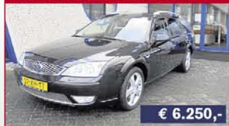
Ford Mondeo wagon 1.8-16V Platinum, 2007, 198.098 km