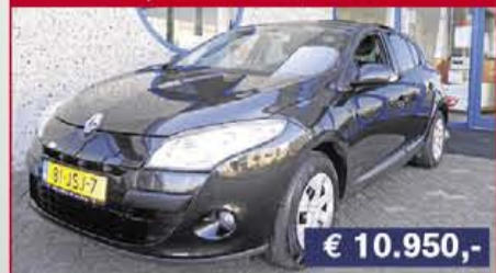
Renault Megane 1.6 Expression, 2009, 49.893 km