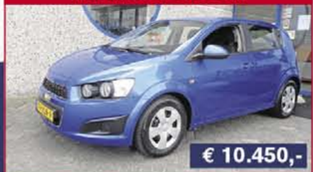
Chevrolet Aveo 1.3d LT, 2012, 30.990 km