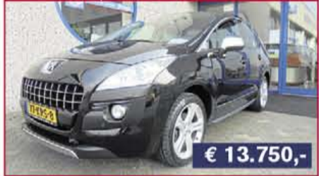
Peugeot 3008 1.6 Thp GT, 2010, 117.668 km