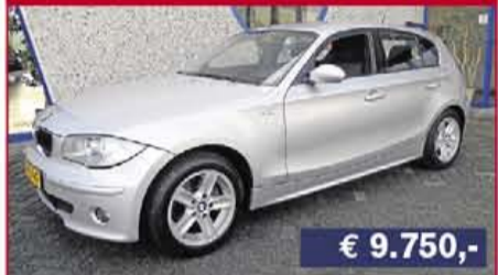
BMW 3-serie 330ci Cabrio Automaat, 2002, 108.870 km