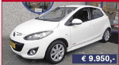
Mazda 2 1.3 Bifuel GT-m line, 2011, 45.817 km