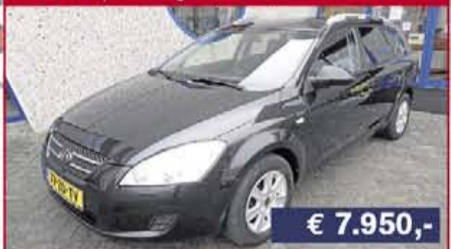
Kia Cee'd 1.6 Sportswagon, 2008, 130.688 km