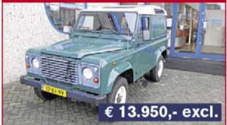
Landrover Defender 90 2003, 87.460