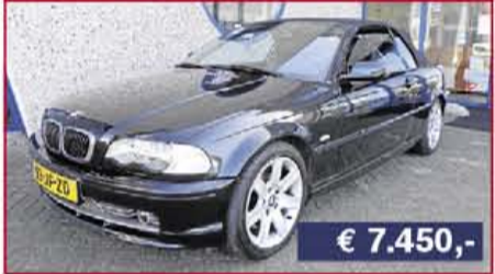
BMW 1-serie 116i, 2005, 150.224 km