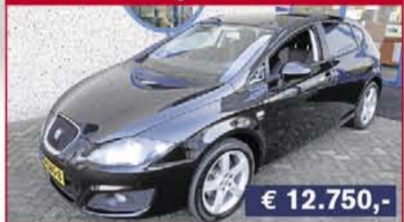
Seat Leon 1.8 Tfsi Bnsl. High, 2010, 111.696 km