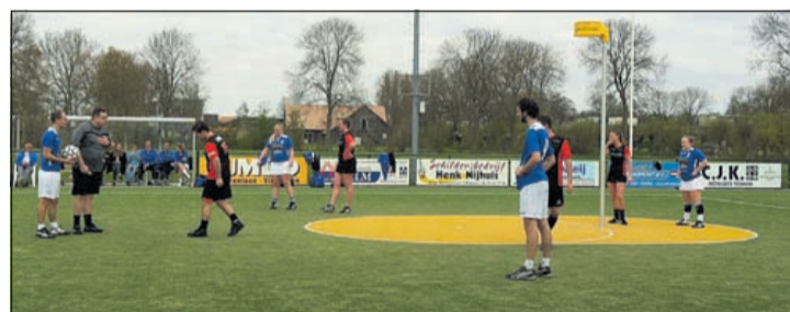
Scheidsrechter roept Triaz-aanvoerder ter verantwoording