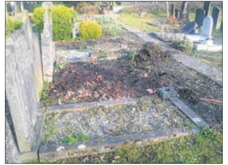
Zo ziet het er uit na het 'bezoekje' van de hovenier

Uithoorn - Vorige week dinsdagochtend bleek dat er op het oude rustieke kerkhofje aan het Zijdelveld een hoveniersbedrijf bezig was om alle beplanting bij de graven weg te halen. Een vreemde zaak, aangezien er al ruim een half jaar grote borden staan waarop duidelijk te lezen valt dat het betreden van het kerkhof op eigen risico is en dat het streng verboden is om het onkruid weg te halen of nieuwe plantjes te poten, dit in verband met de aanwezigheid van asbest. Dit alles in opdracht van de R.-K. parochie, met medewerking van de gemeente Uithoorn. Voor heel veel bezoekers van het kerkhofje was dit op zijn zachtst gezegd verdrietig, maar het was niet anders. Ze bezochten hun geliefde nog wel, maar zagen de boel verwilderen.