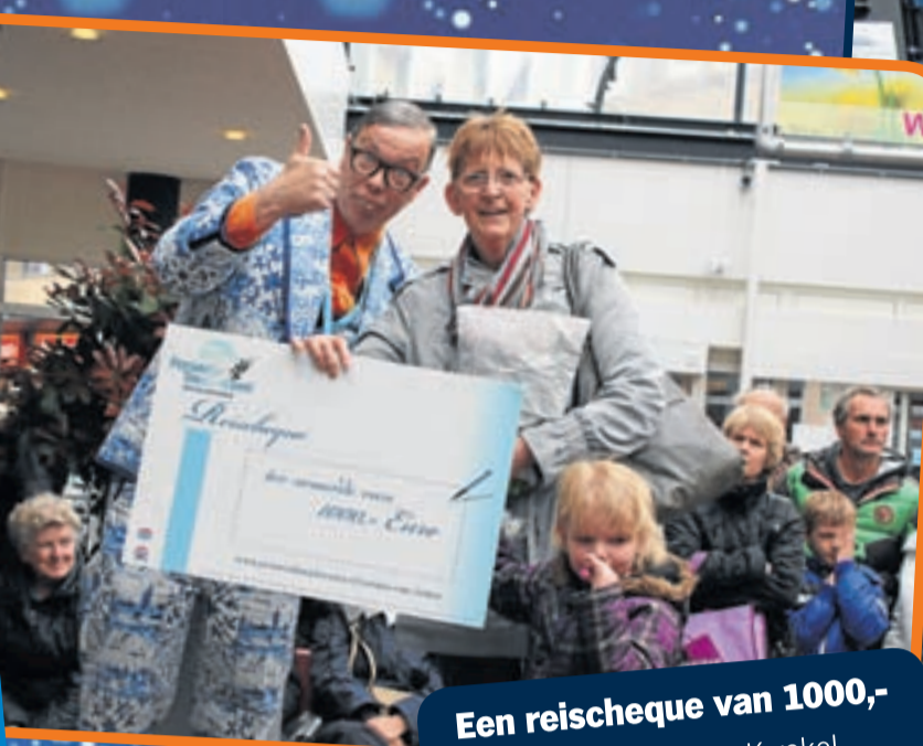
Een reischeque van 1000,- mw Voorn uit De Kwakel