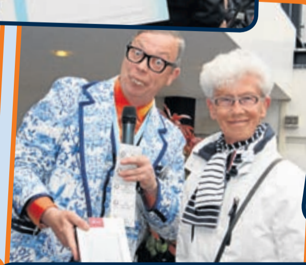
Drie maal een e-Reader werden gewonnen door: mw Gils uit Uithoorn, mw Schouten uit de Amstelhoek en mw Versteeg uit Uithoorn