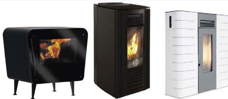
Pelletkachels - CV pelletkachels - Pellet openhaard

STOOKWEEKEND: 24 EN 25 JANUARI MET SPECIALE AANBIEDINGEN