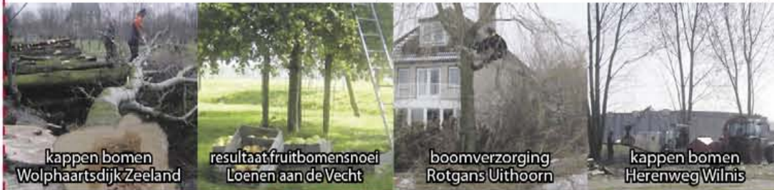
kappen bomen Wolphaartsdijk Zeeland