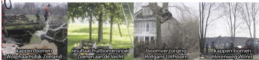
kappen bomen Wolphaartsdijk Zeeland