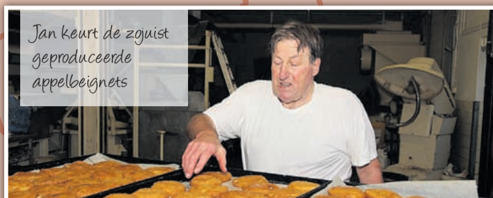
Jan keurt de zguist geproduceerde appelbeignets