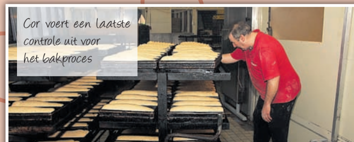
Cor voert een laatste controle uit voor het bakproces