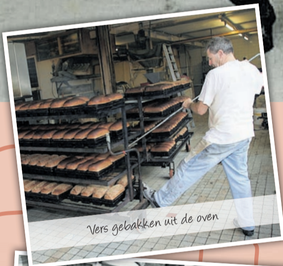
Vers gebakken uit de oven