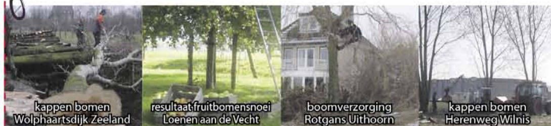
kappen bomen Wolphaartsdijk Zeeland