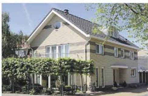
Aalsmeer-Centrum Weteringplantsoen 24

Fraaie, royale vrijstaande villa met dubbele garage, gelegen op een toplocatie in het centrum van Aalsmeer.