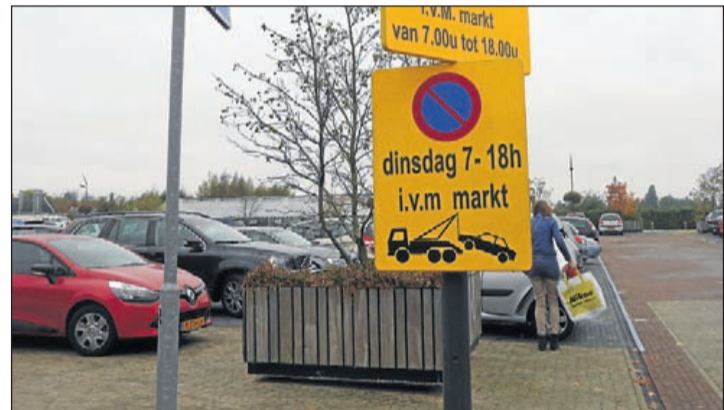
De markt op het Praamlein wordt ingericht in de drie parkeervakken het dichtst in de buurt van de Albert Heijn en de Etos. Iets meer dan een derde deel blijft open en hier kan geparkeerd worden.

toegekend krijgen voordat de uitvoering van maatregelen start. Wilt u weten of u in aanmerking komt voor subsidie of denkt u na over het isoleren van uw huis of over andere duurzame verbouwingen aan uw woning? Dan kunt u contact opnemen met Stichting Sienergie. Dit is een particuliere stichting zonder winstoevendmerk die volstrekt onafhankelijk opereert. De energieadviseurs van Sienergie informeren en adviseren woningeigenaren, huurders en ondernemers in opdracht van de gemeente Aalsmeer over mogelijkheden, om het energieverbruik én de energiekosten te verlagen en het wooncomfort te verhogen. Ook helpen zij bij het aanvragen van energiesubsidie of een duurzaamheidslening en wijzen de weg naar betrouwbare marktpartijen. Meer informatie over verduurzamen van uw woning is vinden op de website: HYPERLINK " http://www.sienergie.nl " www.sienergie.nl of kom naar het energieloket op woensdagmiddag van 15.00 tot 18.00 uur in Het Boekhuis in de Zijdsstraat 12. Meer informatie over subsidies energiebesparende maatregelen, bodemislatie en het aanvraagformulier is te vinden op de website van de gemeente: www.aalsmeer.nl/duurzaam . Hier ook informatie over de duurzaamheidslening.