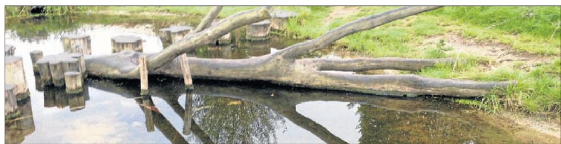
Een voorbeeld van een natuurspeeltuin.