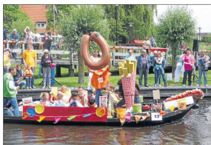
Om trek van te krijgen, patatjes en rookworst. Een van de vele prachtige uitdossingen tijdens de tiende Junior pramenrace.

Aalsmeer - Een dag vol activiteiten wachtte de inwoners afgelopen zaterdag 21 juni. De eerste zomerdag is gevierd met het tweede bruggen-