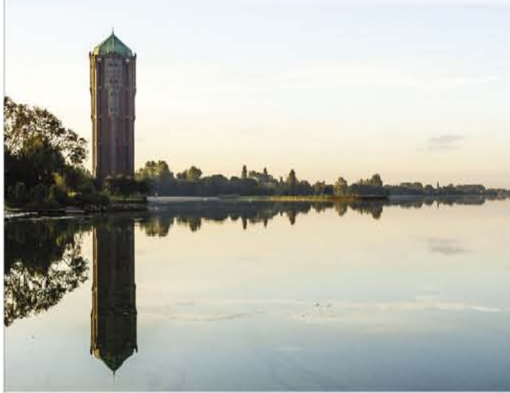
De jachthavens zijn ook met de boot bereikbaar.