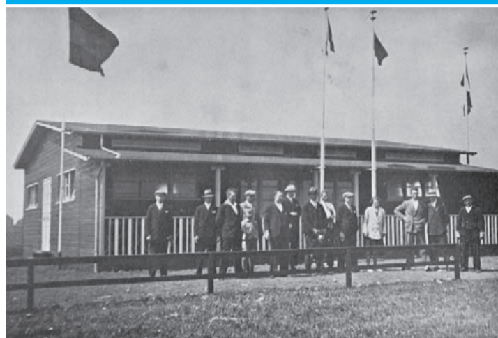
1936: Opening kantine en kleedkamers op complex in Sportlaan.