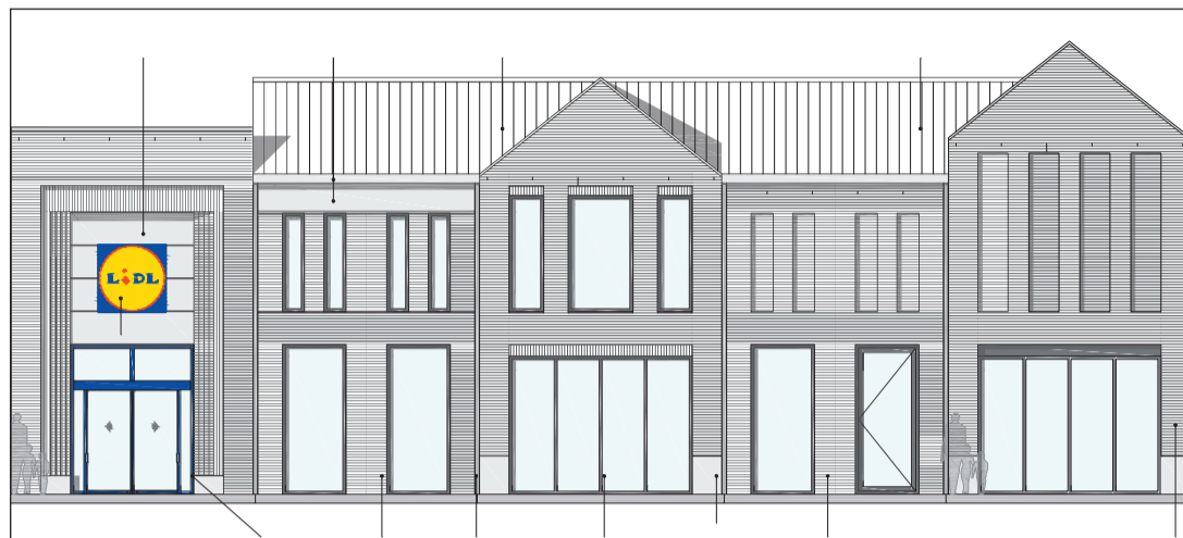
Het ontwerp van de nieuwbouw voor de Lidl, gezien vanaf de Stationsweg.