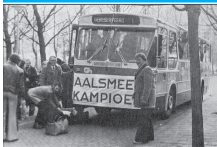
1974-1975: Aalsmeer 1 kampioen en promotie naar de hoofdklasse!