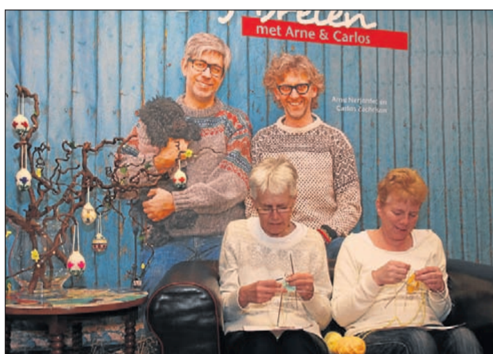
De breidemonstratie trok veel belangstellenden. Foto: www.kicksfotos.nl .

Ook staan voetenmassage avonden gepland, iedereen die het prettig vindt om voeten te masseren en om gemasseerd te worden is welkom. Data van de Reiki-cursus I zijn vrijdagavond 21 en zaterdag 22 februari en vrijdagavond 11 en zaterdag 12 april. Reiki II op zaterdag 22 maart 2014. In overleg is ook een andere datum mogelijk. Voor meer informatie, prijzen en data over de activiteiten: elise.reiki@gmail.com of meld je aan voor de Nieuwsbrief. Telefoon: 0297-340684.