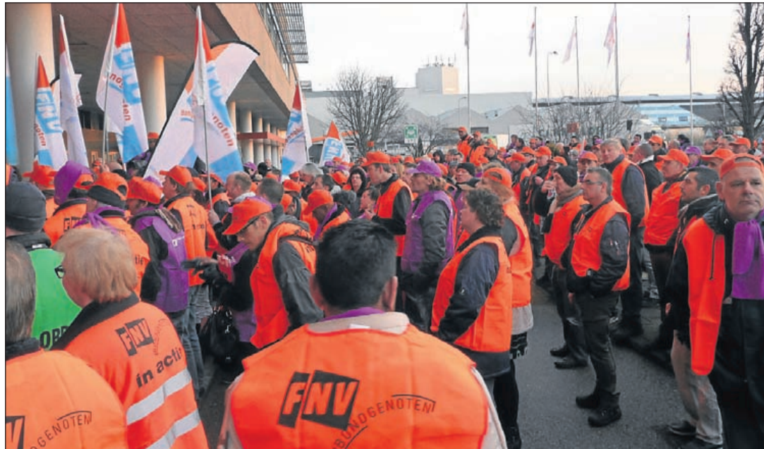
Luide protesten vijfhonderd actievoerders voor veilinggebouw

Aalsmeer - Rond middernacht op donderdag 6 februari is ingebroken in een woning aan de Machineweg. De dief wist binnen te komen door via een met karton afgeplakte ruit de achterdeur te openen. Diverse kamers zijn doorzocht. De inbreker is er in ieder geval vandoor gegaan met een navigatiesysteem en een laptop.