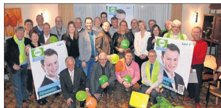
Grote belangstelling van CDA'ers voor de stoomcursus gemeenteraadslid en de aftrap van de campagne 'Verfrissend & Verstandig'.

een of andere wijze voldoende voel-spiet in de Aalsmeerse gemeenschap hebben. De Wmo-raad vergadert op woensdag 19 februari om 15.00 uur in vergaderkamer 011 van het gemeentehuis. De vergadering is openbaar. Tussen 14.30 en 15.00 uur bestaat de mogelijkheid om leden van de Wmo-raad deelgenoot te maken van uw ervaringen met de Wmo. De Wmo-raad kan en mag uiteraard geen individuele zaken in behandeling nemen of optreden als bemiddelaar, maar kan wel een luisterend oor bieden met als doel het optimaliseren van het Wmo-loket en de Wmo-voorzieningen/diensten. In voorkomende gevallen zullen de bevindingen van de Wmo-raad zo nodig anoniem besproken worden met het WMO-loket of desbetreffende beleidsambtenaren. Vanaf 14.30 uur bent u van harte welkom. Het is wel gewenst dat u zich meldt bij de receptie van het gemeentehuis.