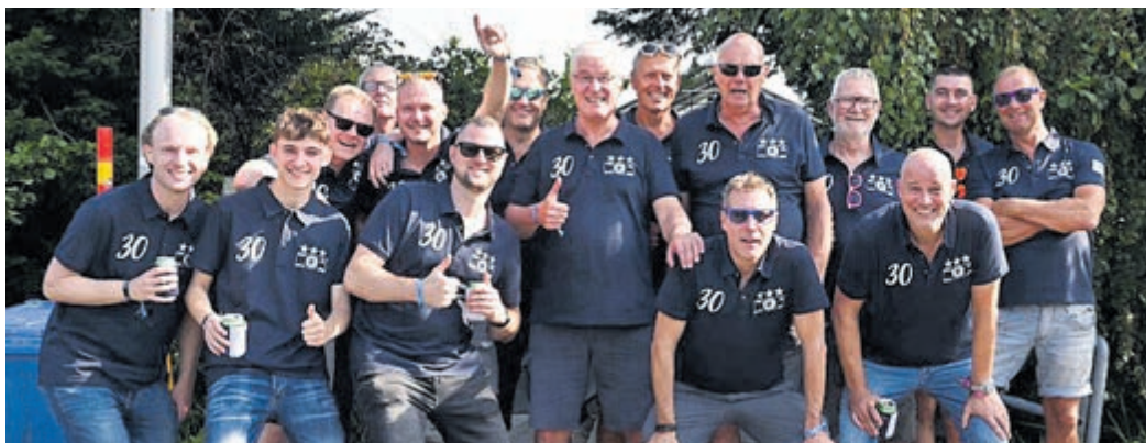
De Vreeselijke Vreekens in het blauw...