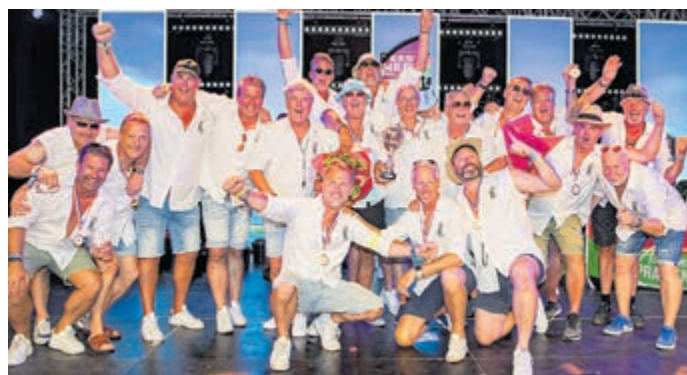
Dubbelslag voor team ABRA-CaHaDiBa.

Twee keer goud! En natuurlijk smaakt dat naar meer. De uitgebalanceerde voeding en het juiste sapje zijn een welkome aanvulling waarop de teamleden kunnen teren. Vandaar dat de captains, ja er zijn er meerdere op één schip, ongeveer 33 al maanden op een geheime locatie aan het trainen zijn. Nog beter, sneller, mooier en gekker dan alle eerdere edities komt ABRA-CaHaDiBa